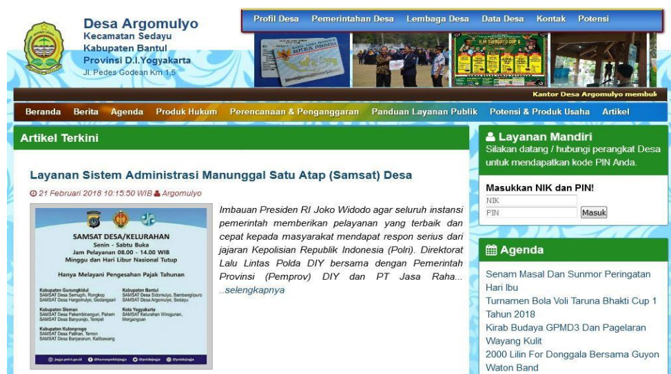
Website Desa Argomulyo