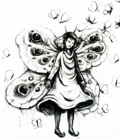
Gambar 3.2 Penggambaran Pakaian Ratu Kupu-Kupu