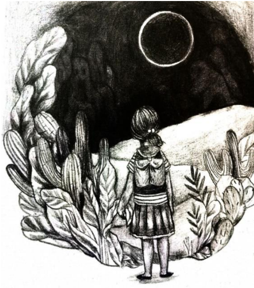
Gambar 3.1 Penggambaran Pakaian Tokoh Mata

Tidak hanya ditemukan adanya femininitas terhadap perempuan secara psikis, namun peneliti juga menemukan bagaimana stereotip gender secara fisik yaitu melalui pakaian yang dikenakan tokoh laki-laki dan perempuan dalam novel “Mata di Tanah Melus”. Novel dengan tema petualang ini menghadirkan sosok Mata, anak perempuan yang menelusuri berbagai macam tempat outdoor , namun digambarkan anak perempuan tersebut mengenakan rok seperti pada ilustrasi berikut: