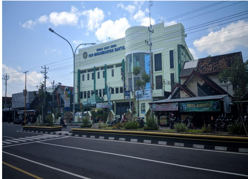
Gambar 3.2 Lokasi penelitian (Rumah Sakit PKU Muhammadiyah Bantul)