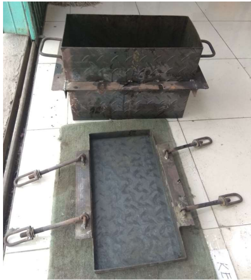
Gambar 3.7 Cetakan Benda Uji

Cetakan benda uji yang digunakan berbentuk box berbahan plat besi ukuran panjang 40 cm, lebar 20 cm, tinggi 30 cm, serta memiliki ketebalan 2,8 mm yang dirangkai dengan 4 buah baut pengunci dan plat penahan pada bagian bawahnya. Cetakan ini digunakan untuk membentuk material benda uji seperti yang direncanakan dan menjaga bentuk benda uji pada saat pengujian tekan. Cetakan benda uji yang digunakan pada penelitian dapat dilihat pada Gambar 3.7.