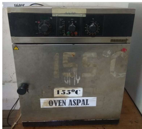
Gambar 3.3 Oven Aspal