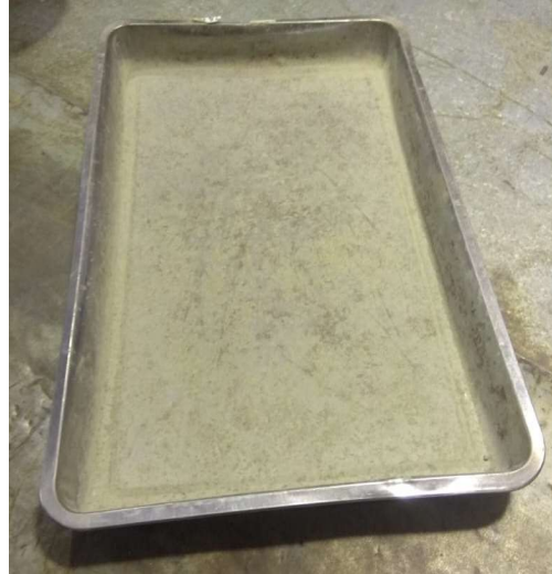
Gambar 3.4 Nampan Logam