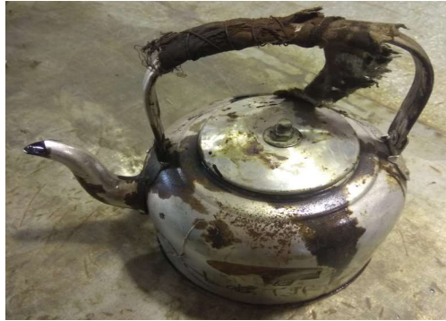
Gambar 3.6 Teko

Teko digunakan sebagai wadah aspal yang akan dicairkan di dalam oven, sekaligus digunakan untuk menuang aspal pada benda uji. Teko yang digunakan seperti pada Gambar 3.6.