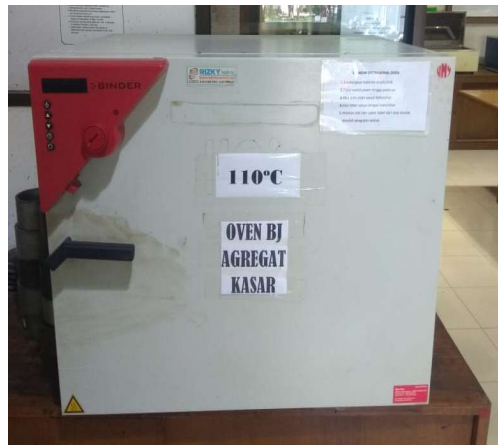
Gambar 3.2 Oven Agregat

Oven digunakan untuk mengeringkan agregat dan mencairkan aspal. Oven yang digunakan untuk mengeringkan agregat adalah oven dengan suhu 110 C° seperti pada Gambar 3.2 dan oven yang digunakan untuk mencairkan aspal adalah oven dengan suhu 155 C° seperti pada Gambar 3.3.