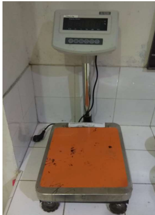
Gambar 3.5 Timbangan

Timbangan digunakan untuk mengukur berat dari material dan alat, serta mengukur berat benda uji dalam penelitian ini. Timbangan yang digunakan adalah timbangan dengan kapasitas beban maksimal 75 kg dengan tingkat ketelitian 5 gr seperti pada Gambar 3.5.