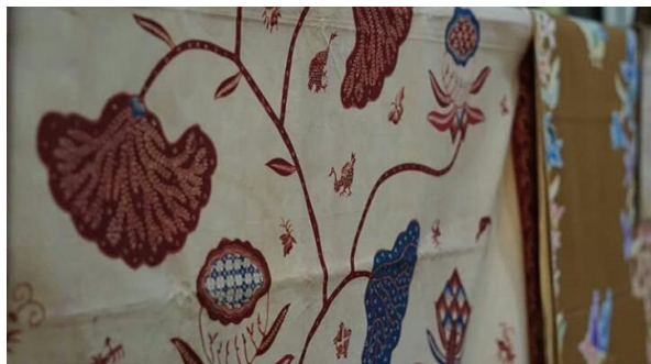
Batik Peranakan Tionghoa