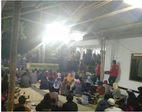
Suasana perkumpulan warga kampung Ketandan