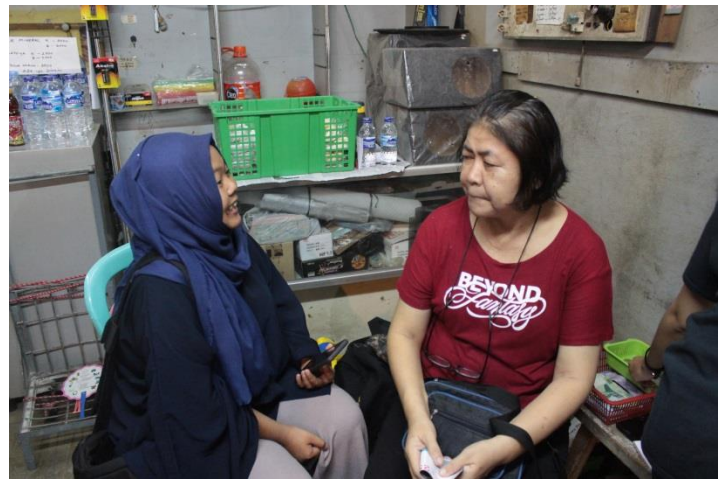
Wawancara dengan Narasumber