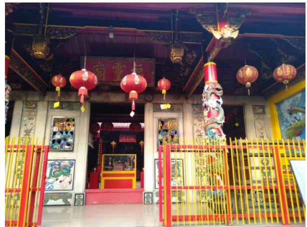
Bentuk Kelenteng di kampung Ketandan