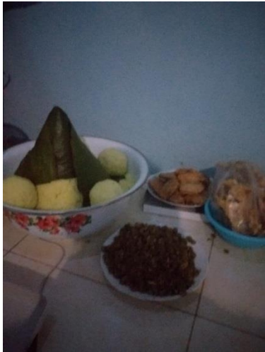
Hidangan Bancaan Weton