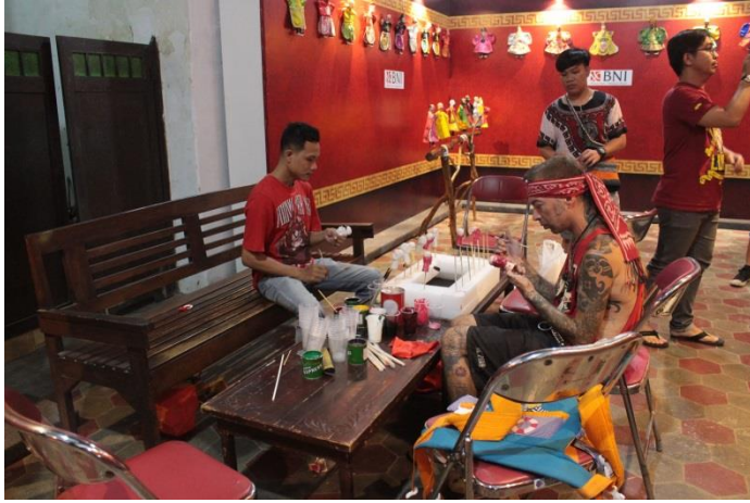
Pembuatan Wayang Potehi