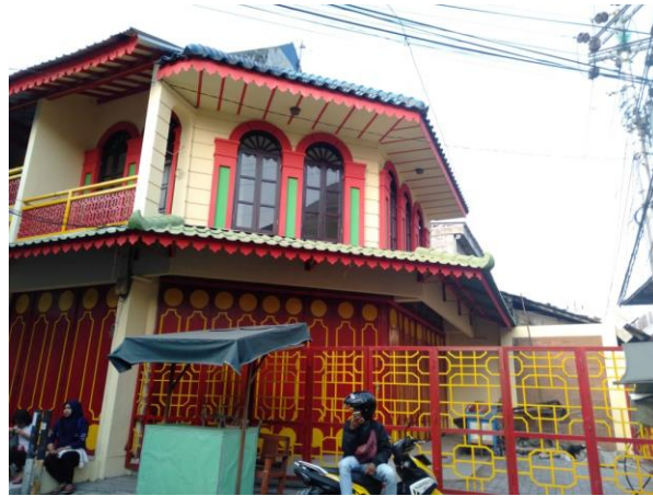
Salah satu rumah sekaligus toko milik warga Tionghoa