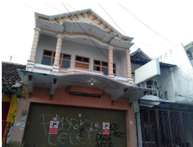
Salah satu rumah di kampung Ketandan