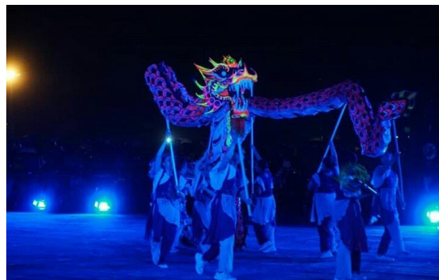
Penampilan naga Liong di PBTY 2019