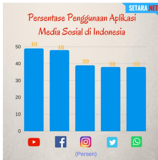
Gambar 2. 1 Chart YouTube Indonesia 2017