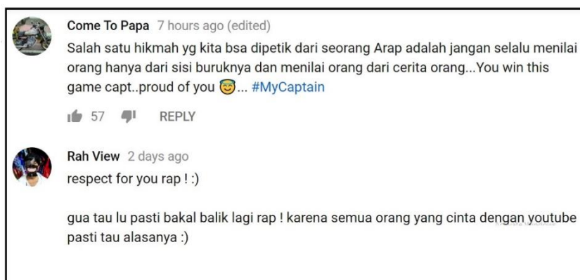
Gambar 2.10 komentar Channel YouTube Reza Oktovian