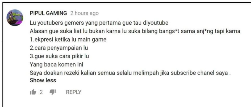
Gambar 2.11 komentar Channel YouTube Reza Oktovian