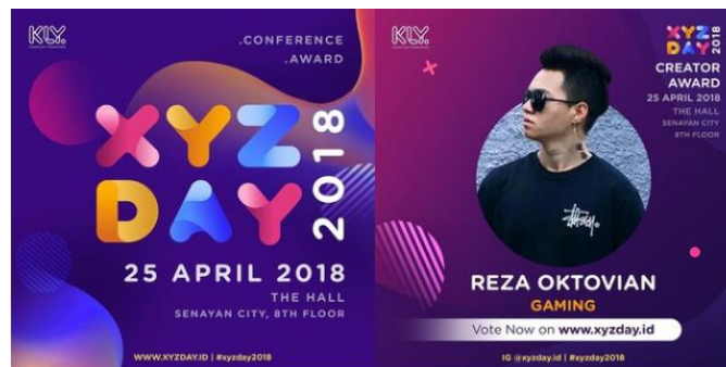
Gambar 2. 6 penghargaan acara XYZ kategori konten game