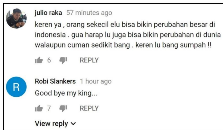
Gambar 2.9 komentar Channel YouTube Reza Oktovian