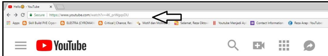
Gambar 2.13 share link Channel YouTube Reza Oktovian