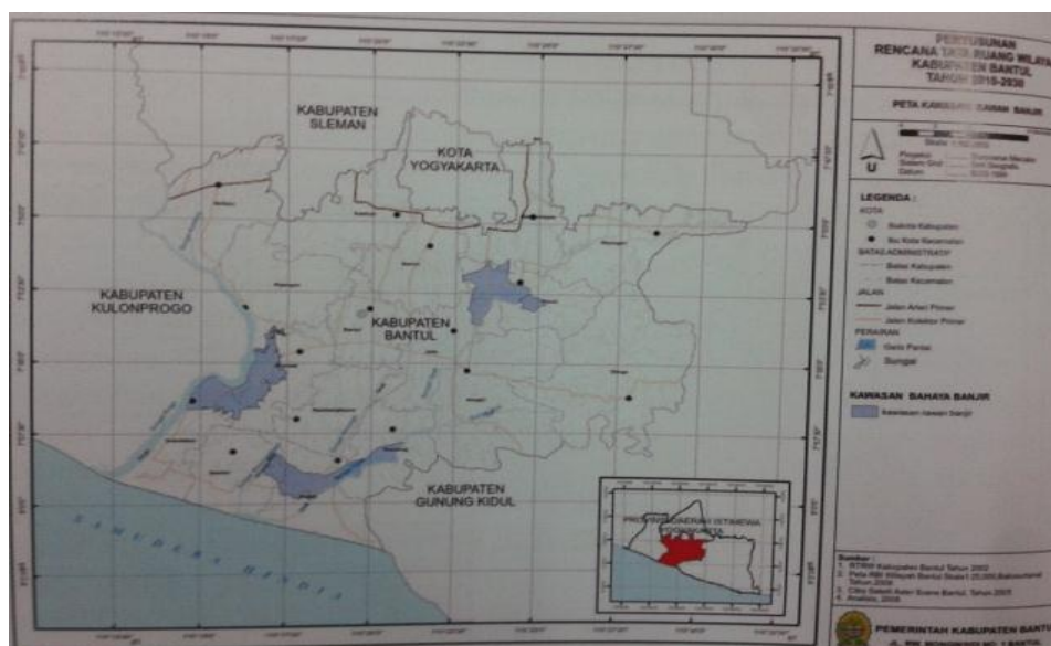
Gambar 1. Peta Bahaya Banjir

Berdasarkan peta bencana banjir Kabupaten Bantul daerah penelitian tidak termasuk dalam daerah rawan banjir (Gambar 6). Selain itu lahan tidak memungkinkan terjadi genangan sebab tekstur tanah berupa pasir sehingga air mudah untuk meresap atau lolos. Berdasarkan hal tersebut dapat dikatakan bahwa bahaya banjir bagian lahan pasir Parangtritis dapat diabaikan atau termasuk golongan F0 dimana dalam kriteria kesesuaian lahan golongan F0 termasuk dalam kelas S1 atau sangat sesuai.