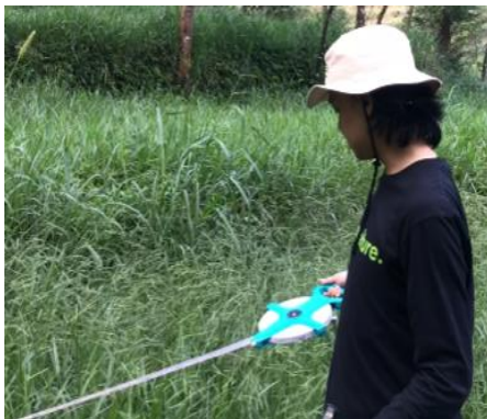
c. Pengukuran Jarak Pohon