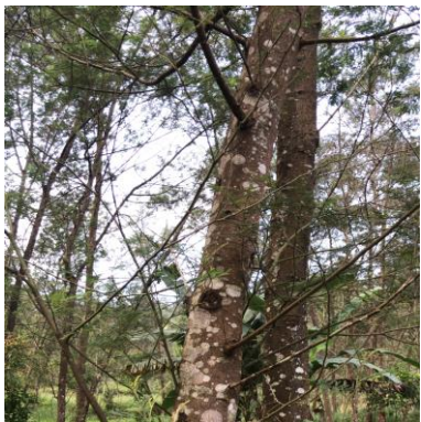
c. Soga ( Acacia decurrens )