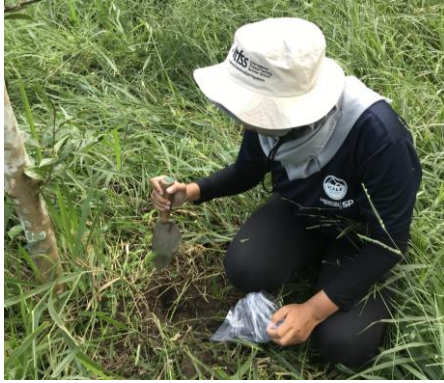
a. Pengambilan Sampel Tanah