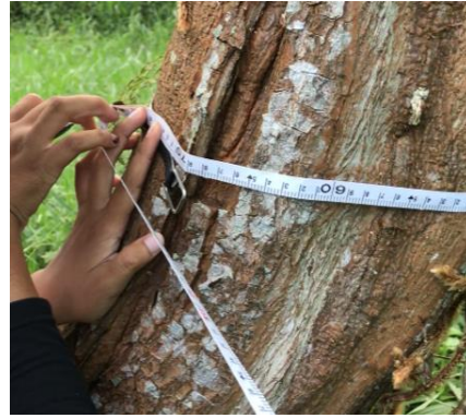
b. Pengukuran Lingkar Pohon