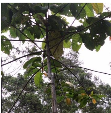
i. Tutup/Mara ( Macaranga tanarius )