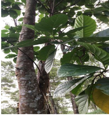
a. Kina ( Cinchona )