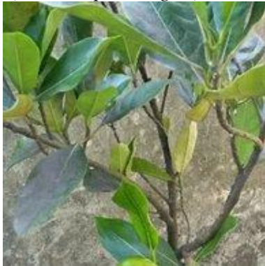
k. Nangka ( Artocarpus heterophyllus )