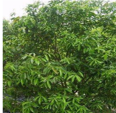
l. Mahkota Dewa ( Phaleria macrocarpa )