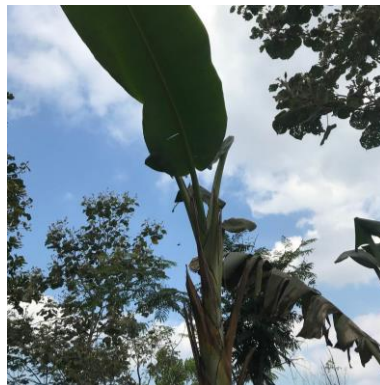
f. Pisang ( Musa paradisiaca L)