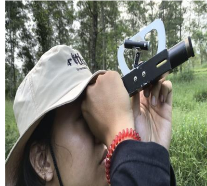
d. Pengukuran Sudut Pohon