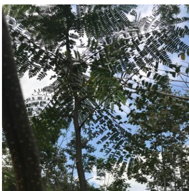
g. Sengon ( Albizia chinensis )