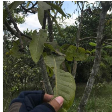
d. Manga ( Mangifera indica )