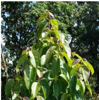
m. Rasamala ( Altingia excelsa Noronha )