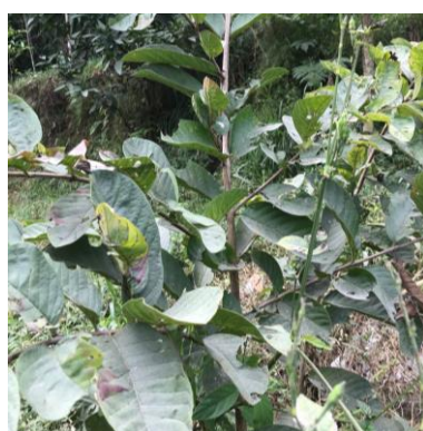
h. Jambu biji ( Psidium guajava )