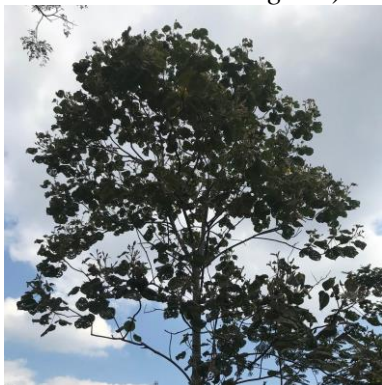
e. Waru ( Hibiscus tiliaceus )

Lampiran 6. Spesies Pohon Waru ( Hibiscus tiliaceus ), Pisang ( Musa paradisiaca L), Sengon ( Albizia chinensis ), Jambu biji ( Psidium guajava ), Tutup/Mara ( Macaranga tanarius ), dan Akasia ( Acacia mangium )