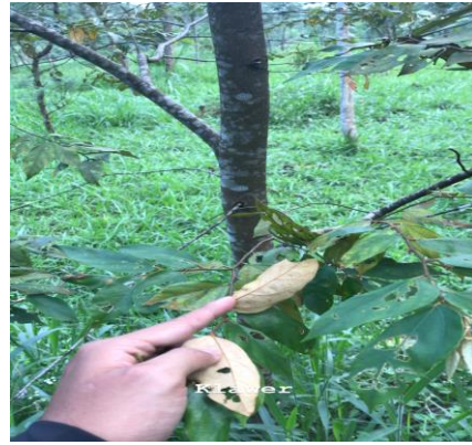
b. Klawer ( Engelhardia spicata )