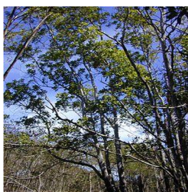
j. Akasia ( Acacia mangium )