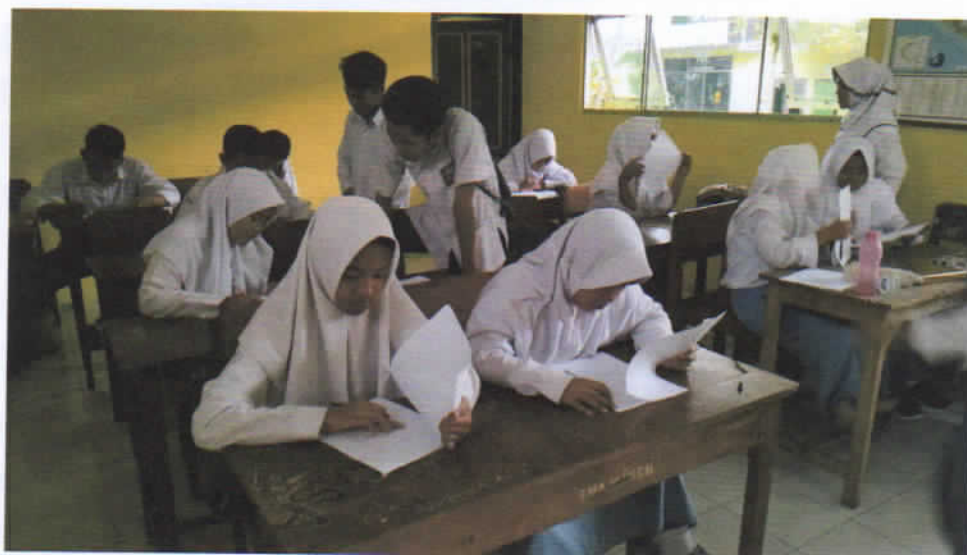
FOTO PENYEBARAN KUISIONER