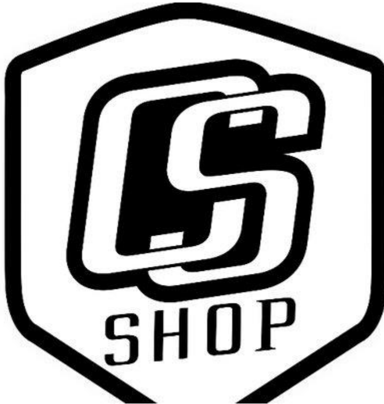
Gambar 4.2 logo Curva Sud Shop