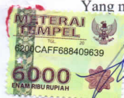
Renita Fahdaniatus S