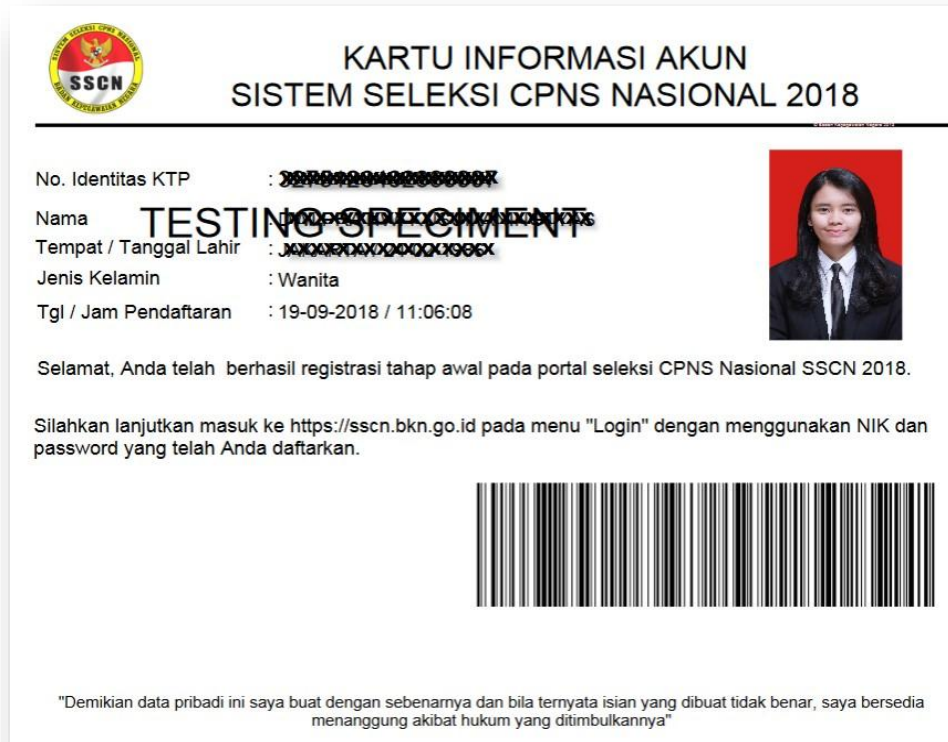
Gambar 2. Contoh Kartu Informasi Akun Sistem Seleksi CPNS Nasional 2018