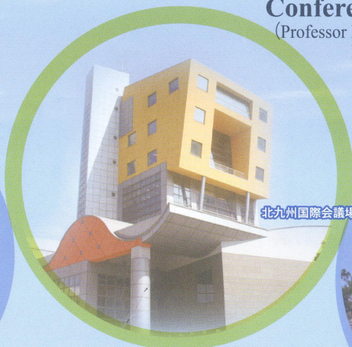
北九州国際会議場