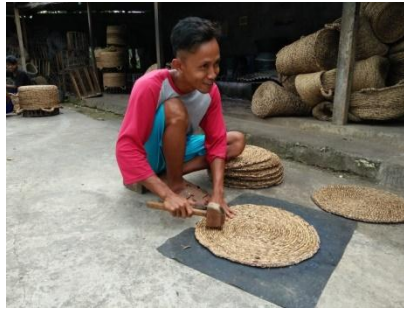
Gambar 2.4 Kerajinan Enceng Gondok