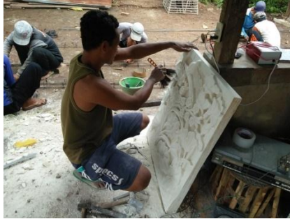
Gambar 2.3 Kerajinan Batu Ukir