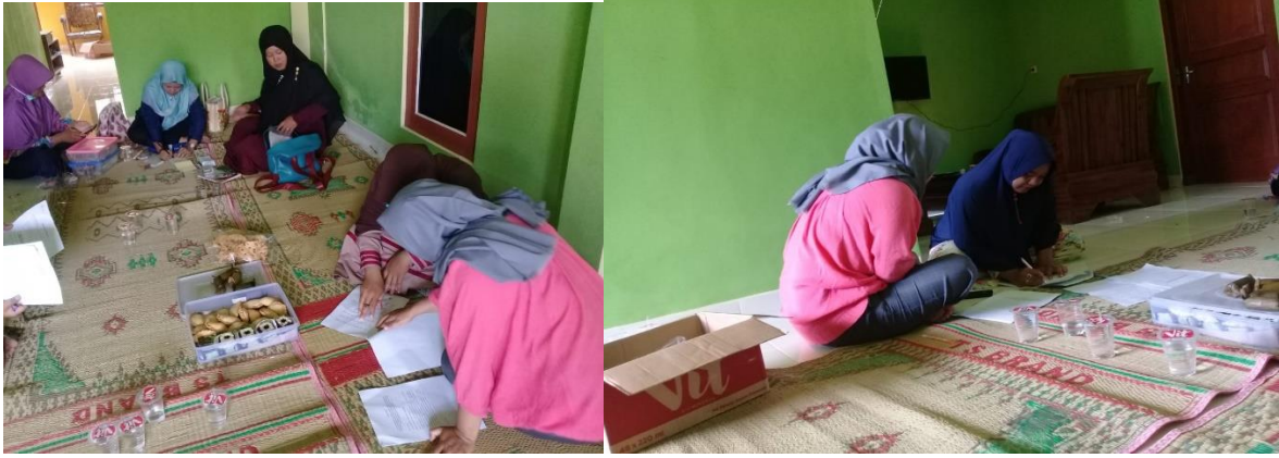
Wawancara dengan mustahik Rumah Zakat Yogyakarta