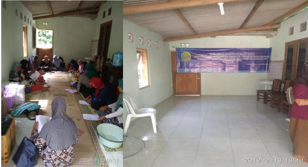
Wawancara dengan Mustahik Kampoeng Ternak, Dompot Dhuafa