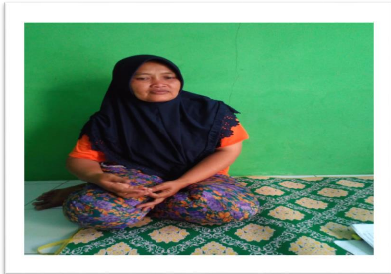
Informan 10 Ibu Peternak dan penjual kambing