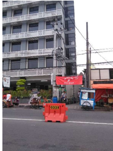
Kampung Sosrowijayan Kulon RW 03 jika dilihat dari depan stasiun Jogjakarta