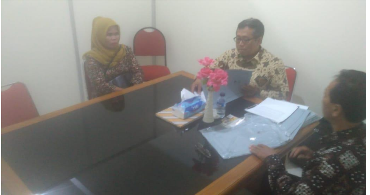
Proses Mediasi Di pengadilan Agama Sleman