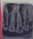
Gambar.2 Preparasi saluran akar untuk gigi insersi pasak gigi 21 Preparasi mahkota untuk gigi 22