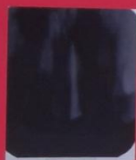
Gambar.1 Gigi 21 pasca obturasi (hermetis)

Dalam restorasi mahkota jacket porcelain fused to metal (PFM), warna, bentuk dan posisi gigi merupakan faktor penting untuk bisa mengembalikan fungsi gigi, termasuk faktor estetika. Hasil perawatan restoratif pada kasus ini lebih baik, satu minggu setelah mahkota Jacket PFM tidak ada keluhan, tidak nyeri, gingiva dan jaringan lunak disekitar gigi normal. Gigi bekerja dengan baik dan mampu mengembalikan kepercayaan diri dari pasien.