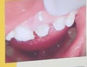
Gambar.5 Penampakan klinis pasca dilakukan preparasi pada gigi 21 dan 22