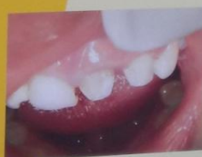
Gambar.5 Penempatan klinis pasca dilakukan preparasi pada gigi 21 dan 22