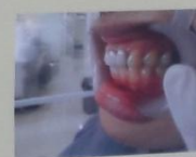
Gambar.7 Satu minggu follow up pasca dilakukan insersi pasak dan mahkota jacket PFM pada gigi 21 dan 22