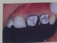
Gambar.6 Try in coping metal