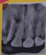
Gambar .4 Mahkota jacket PFM gigi 21,22 pasca insersi