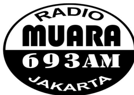
Gambar 2.1 Logo Perusahaan