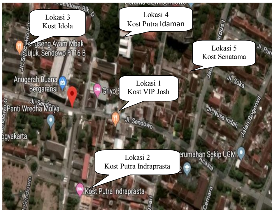
Gambar 3.1 Lokasi penelitian(Sumber: Google Earth, 2018).

Penelitian dilakukan di Bangunan rumah sewa Sendowo, Kelurahan Sinduadi Kecamatan Mlati Kabupaten Sleman Yogyakarta dikarenakan bangunan tersebut merupakan bangunan yang memiliki aktifitas dan perilaku yang cukup tinggi, yang dapat menyebabkan meningkatnya potensi bahaya akibat kebakaran.