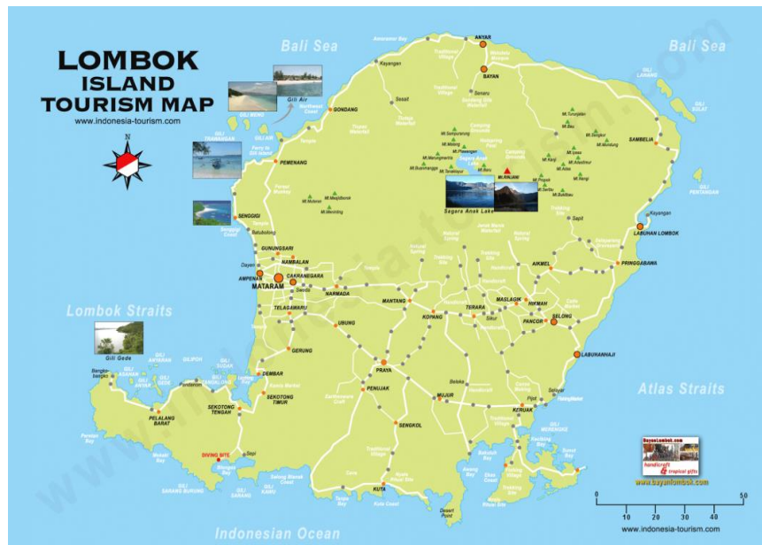
Gambar 4.2 Peta Pulau Lombok

Pulau Lombok yaitu salah satu pulau yang terletak di provinsi Nusa Tenggara Barat dengan luas wilayah mencapai 5.435 km 2 . Jumlah penduduk Pulau Lombok pada tahun 2017 berjumlah 3.311.044 Jiwa. Jumlah penduduk terbesar terdapat di Kabupaten Lombok Timur dan yang terkecil di Kabupaten Lombok Utara. Terdapat 968.754 Rumah Tangga dari jumlah penduduk yang ada di Lombok dengan rata-rata anggota Rumah Tangga sebesar 3,51 orang.