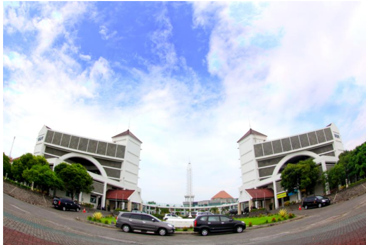
Gambar 1: Universitas Muhammadiyah Yogyakarta

Universitas Muhammadiyah Yogyakarta adalah salah satu perguruan tinggi swasta di Yogyakarta yang beralamat di Kampus Terpadu Universitas Muhammadiyah Yogyakarta, Jalan Lingkar Selatan, Kasihan, Bantul, DI Yogyakarta. Universitas Muhammadiyah Yogyakarta telah terakreditasi "A" dengan SK BAN PT No.061/SK/BAN-PT/Ak-IV/PT/II/2013.