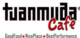
( Gambar 3.6 Perubahan Logo Tuanmuda Café setelah perumusan konsep positioning )

Selain komunitas dan promosi penjualan, Khazali juga menambahkan kalimat “ Good Food Nice Place Best Performance ” pada logonya. Hal itu dilakukan sebagai salah satu wujud positioning dan usaha mengkomunikasikan konsep positioningnya. Logo tersebut diposting dan dijadikan foto profil pada akun instagramnya . Di bawah ini merupakan penampilan logo Tuanmuda Café setelah ditambahkan tagline “ Good Food Nice Place Best Performance ”. Logo itulah yang nantinya akan mendukung perwujudan dari positioning dan menimbulkan satu suara yaitu “ Good Food, Nice Place, Best Performance ”.