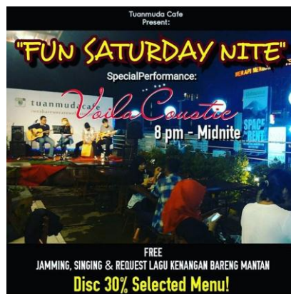
(Gambar 3.1 promo diskon 30% pada menu pilihan)

Promosi penjualan ini memberikan potongan harga sebesar 30% pada tiap menu pilihan yang akan berubah setiap harinya. Setiap pergantian pemain band reguler yang tampil akan diberikan potongan harga pada menu yang berbeda-beda. Misalnya pada contoh di bawah ini merupakan promosi yang dilakukan saat band Voila Coustic akan tampil sebagai band reguler.