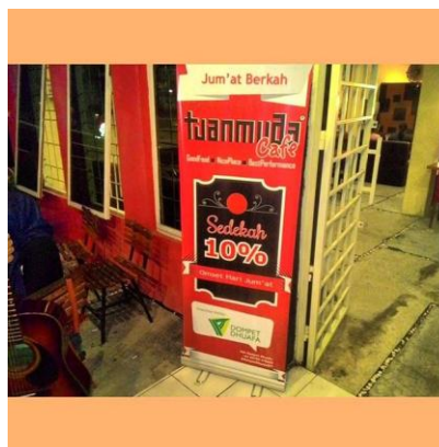
(Gambar 3.3 Sedekah 10 omset di hari Jumat)

Khazali mengatakan bahwa program sedekah ini merupakan bentuk kemanusiaan dari Tuanmuda Café. Tetapi dengan memostingnya di akun sosial media, secara tidak langsung tercipta peluang untuk mendatangkan pelanggan yang ingin ikut berbagi. Hasil omset yang didapat pada hari Jumat ini nantinya akan dipotong sebesar 10% untuk sedekah.