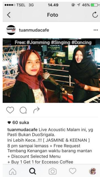
(Gambar 3.2 Promo beli 1 gratis 1 porsi Eccesso Coffee)