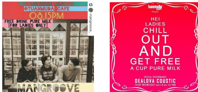
(Gambar 3.4 Minuman olahan susu gratis untuk perempuan)

Di hari tertentu, Tuanmuda Café juga memberikan secangkir susu murni secara cuma-cuma untuk pelanggan perempuan yang datang sebagai wujud penghargaan sekaligus menarik perhatian mereka.