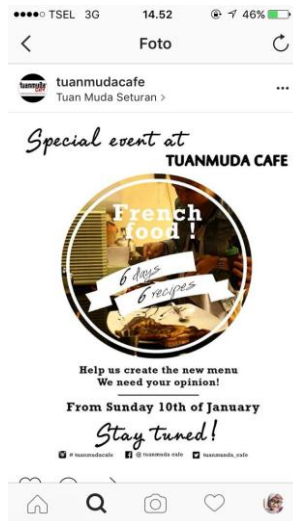
(Gambar 3.5 Test food free)