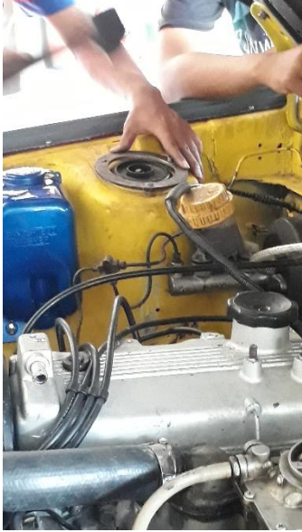
Gambar pengukuran dudukan