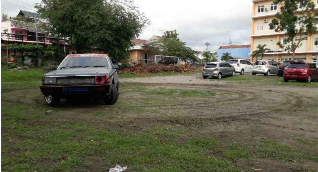
Gambar Mitsubishi Lancer SL setelah proses development

Mitsubishi Lancer SL sesudah development.