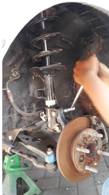
Gambar suspensi yang sudah terpasang pada mobil