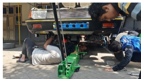
Gambar pengerjaan sistem suspensi