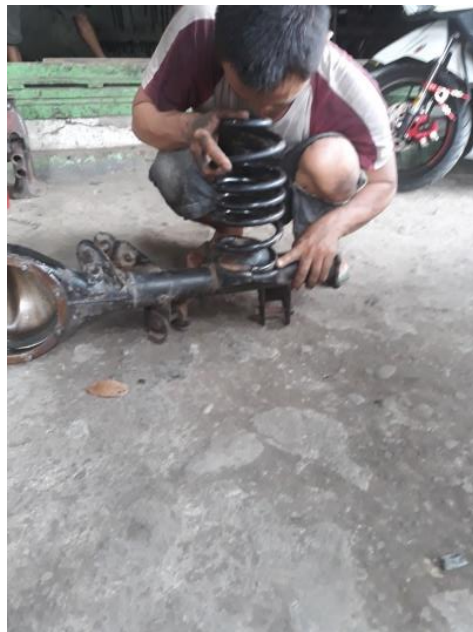
Gambar Per sesudah development