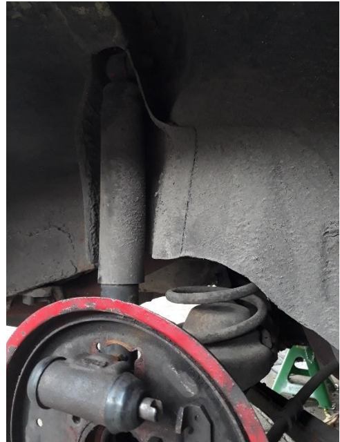
Gambar shock belakang original