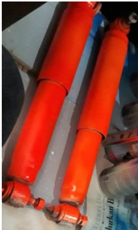
Gambar absorber belakang sesudah development