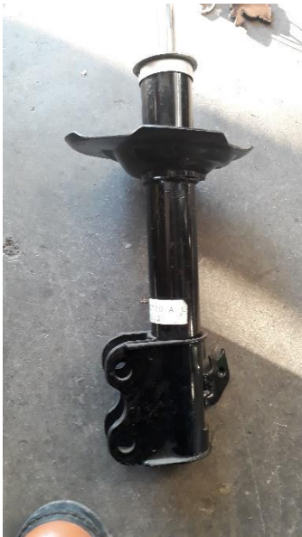
Gambar suspensi Toyota avanza

Hunting suspensi untuk proses development