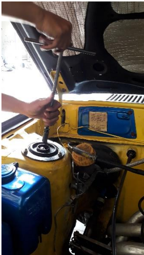
Gambar pemasangan dudukan strut bar