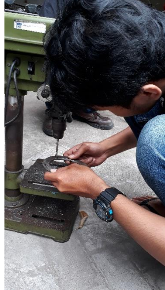
Gambar pengeboran dudukan strut bar