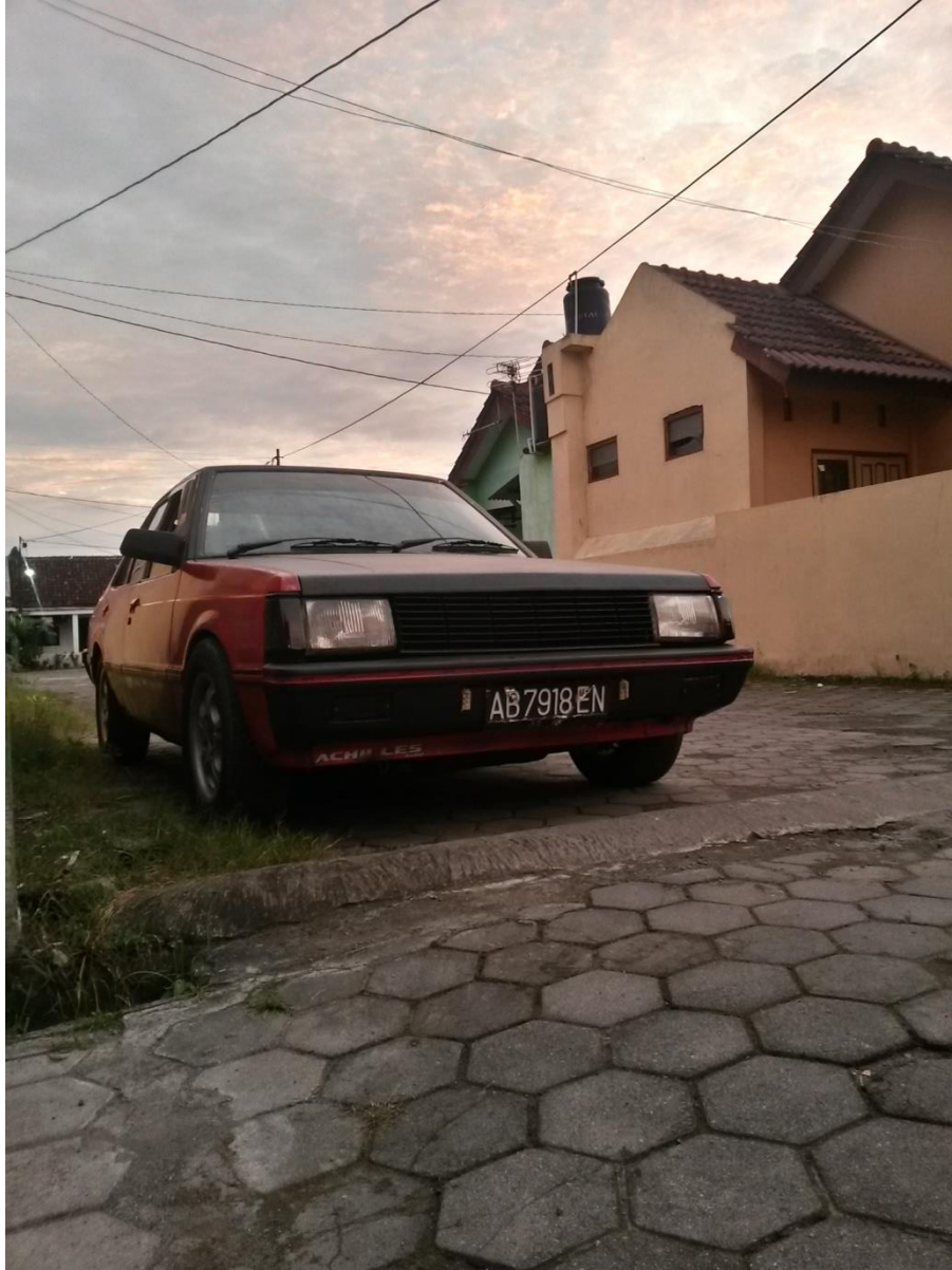
Gambar Mitsubishi Lancer SL sebelum proses development

Mitsubishi Lancer SL sebelum proses development.