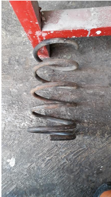
Gambar per sebelum development

Per belakang sebelum dan sesudah development