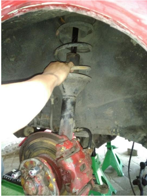
Gambar shock depan original

Suspensi Mitsubishi Lancer SL sebelum dilakukan development