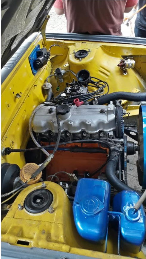
Gambar sebelum pemasangan sturt bar

Mitsubishi lancer SL sebelum dan sesudah pemasangan Strut Bar