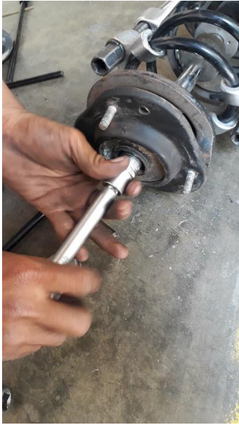
Gambar suspensi yang sedang di rakit

Pemasangan suspensi yang sudah di development.