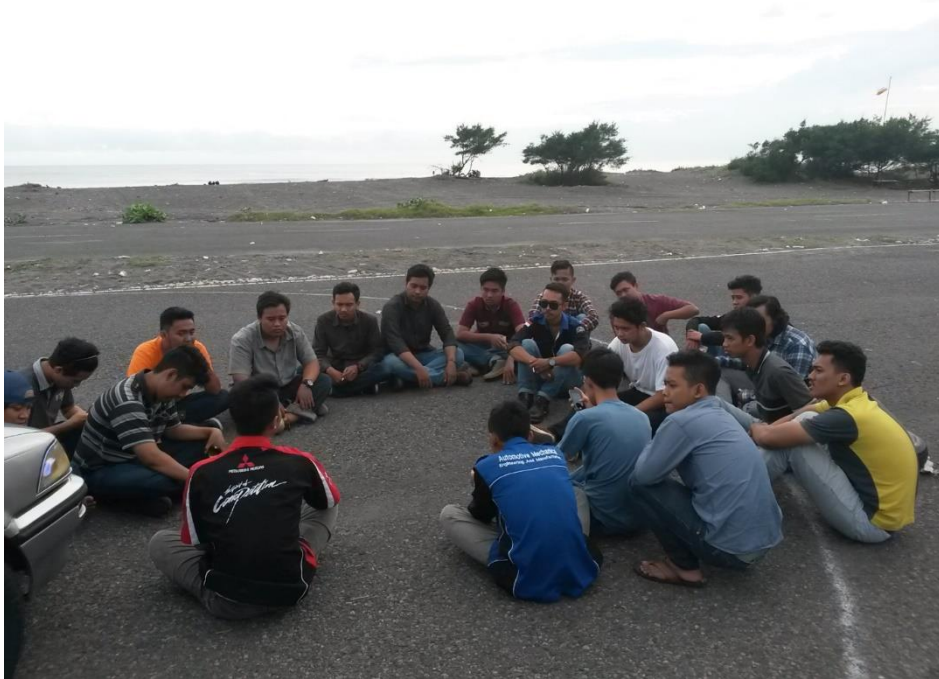
Gambar rapat Tim Drifting dan Speed Ofroad