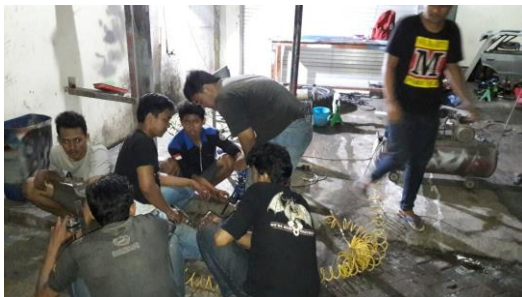
Gambar pengerjaan sistem suspensi