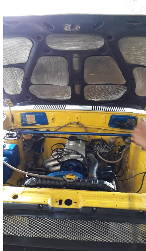
Gambar setelah pemasangan strut bar