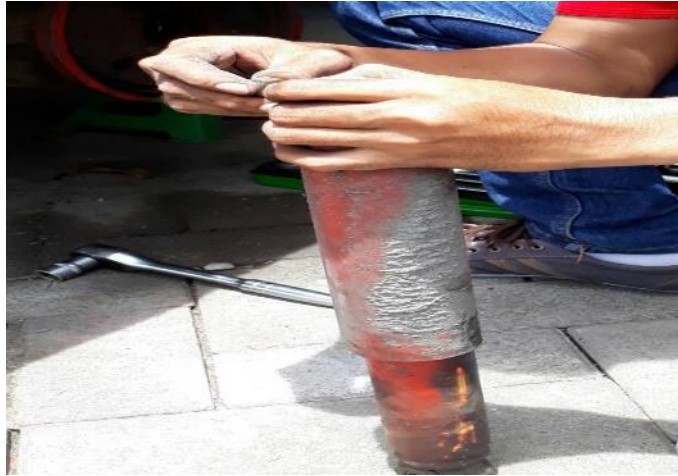
Gambar absorber belakang sebelum development

Absorber belakang sebelum dan sesudah development.