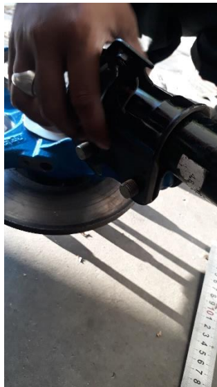
Gambar proses hunting suspensi