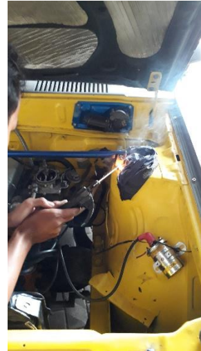
Gambar proses pengelasan dudukan