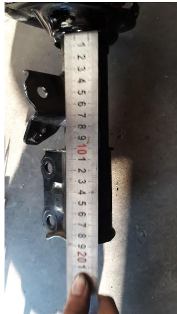
gambar pengukuran suspensi