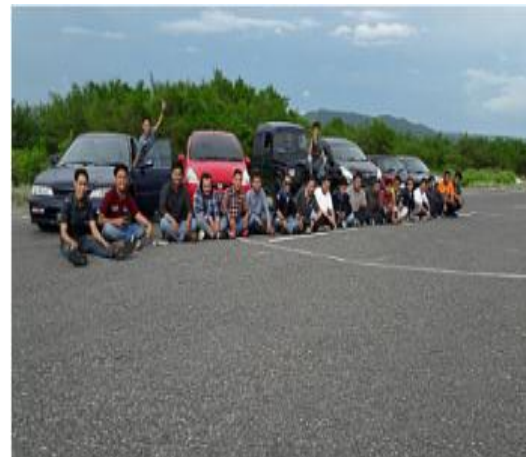
Team Drifting dan Team Offroad