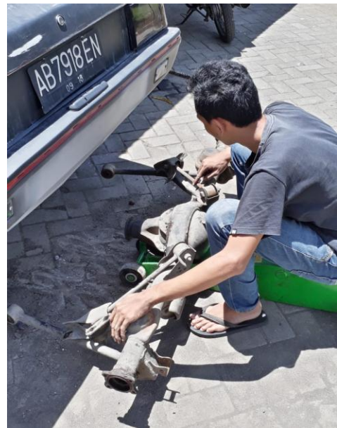
Gambar Proses penurunan unit Differential Mitsubishi Lancer SL