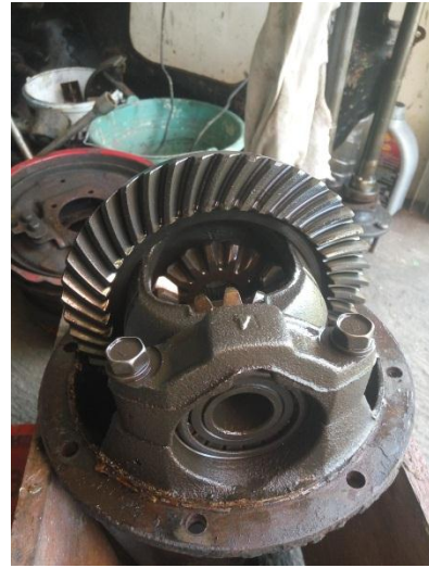
Gambar Gardan sebelum development.