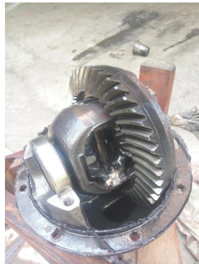
Gambar Gardan sesudah development.