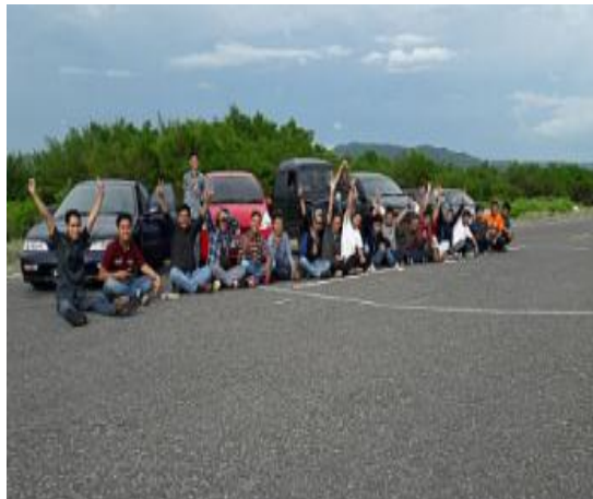
Lokasi Landasan Pacu Pantai Depok Yogyakarta