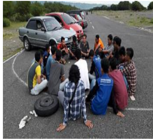
Team Drifting dan Team Offroad