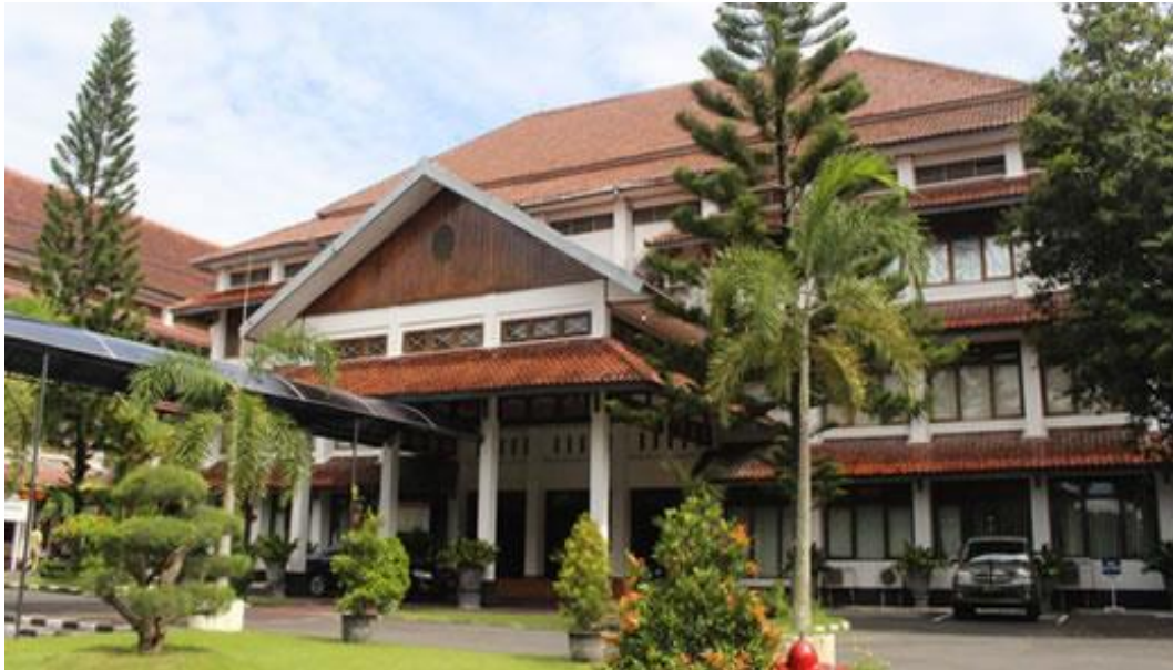
Gambar 2.1 Badan Kepegawaian Daerah (BKD) Kab Bantul.