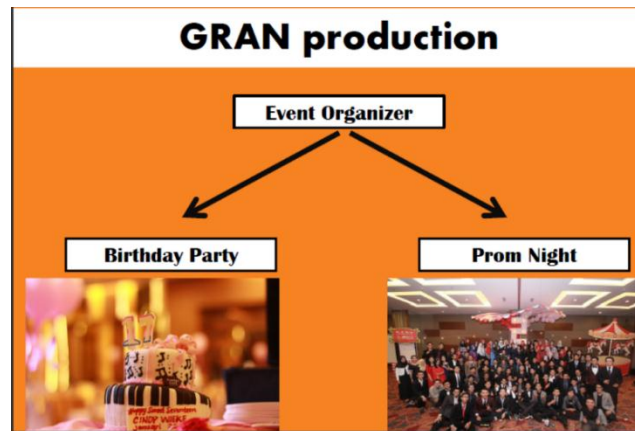
Gambar 2.4 Jasa Party Planner Gran Production