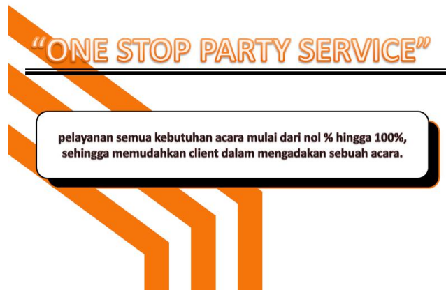
Gambar 2.3 Slogan/Tagline Gran Production