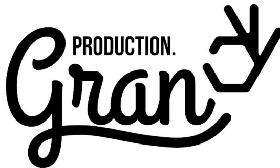
Gambar 2.1 Logo Gran Production

Kemudian berlanjut dijenjang perguruan tinggi mereka memiliki visi dan misi yang sama untuk membuat Gran Production ini dan sampai sekarang bisa bertahan dipasar mereka hingga 4 tahun lebih lamanya. (Arsip Gran Production Tahun 2017)