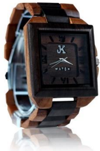
3. VICTORY Harga : Rp 700.000