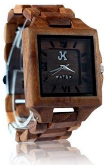
5. QIYU Harga : Rp 800.000