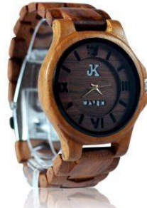
2. JORDA Harga : Rp 700.000