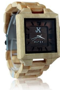
4. COULD Harga : Rp 800.000