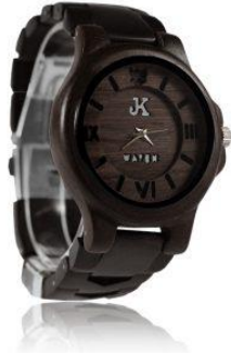
1. OASE Harga : Rp 800.000