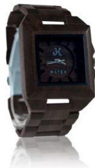
Gambar 2.2 Katalog dari JK Watch