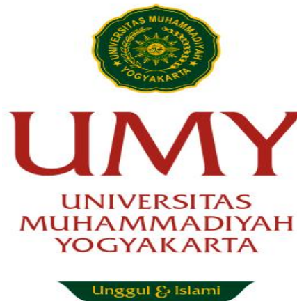
Gambar 2. 1 Logo UMY