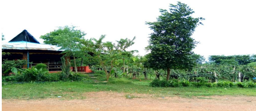
(Kebun Buah Naga Zore)