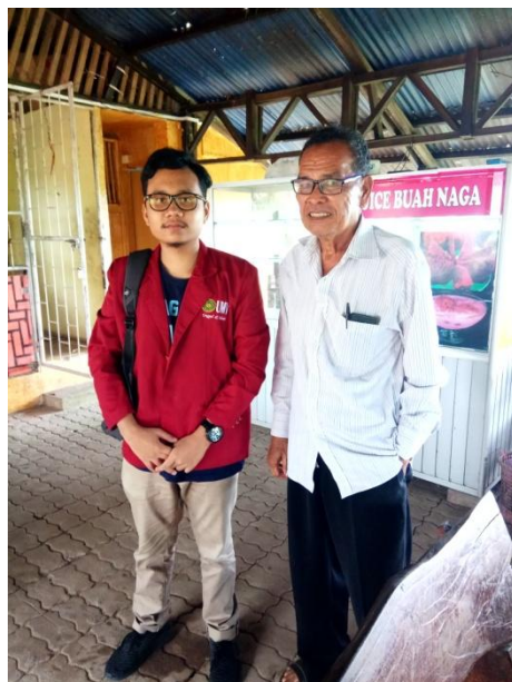
(Pemilik/Pengelola Kebun Buah Naga Zore)