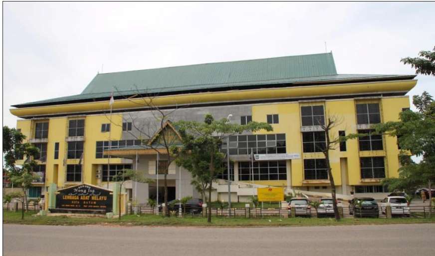
(Kantor Dinas Kebudayaan dan Pariwisata Kota Batam)