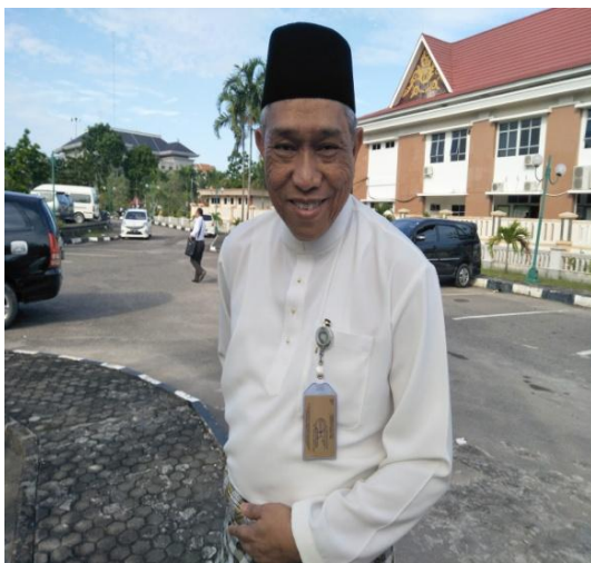
(Kepala Dinas Kebudayaan dan Pariwisata Kota Batam)