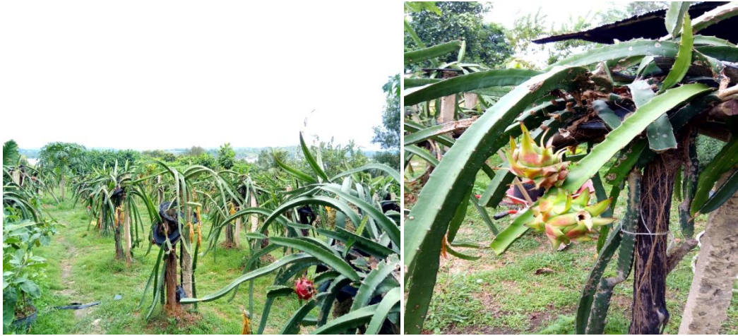
(Kebun Buah Naga Zore)