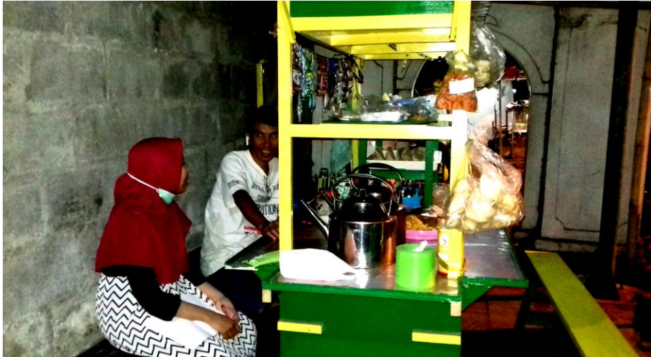
Lampiran 1. 6