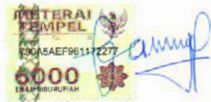
Mochamad Faisal Rinjani