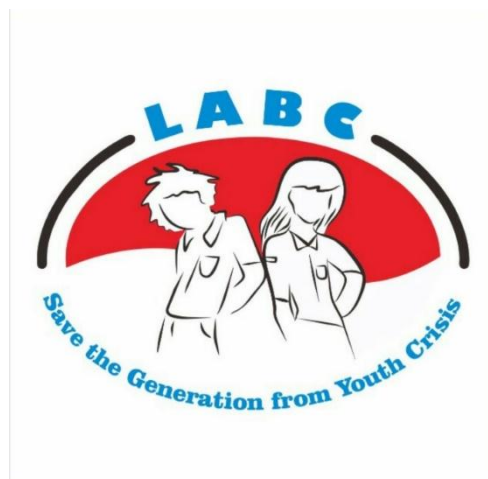
Logo Lentera Anak Bangsa Cerdas (LABC)