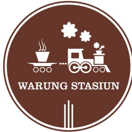
Gambar 2.2 Logo Warung Stasiun