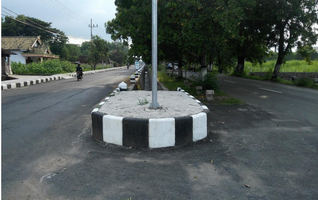
Lampiran 1 Foto kondisi jalan untuk survey lalu lintas harian rata – rata.