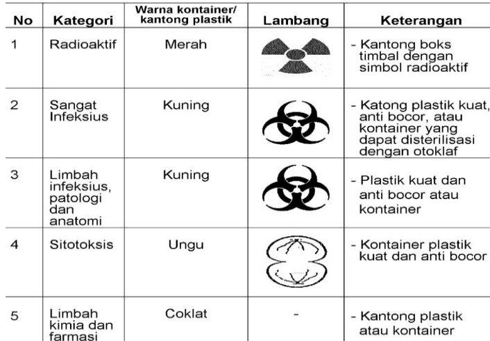
Tabel 2.3 Pewadahan limbah medis