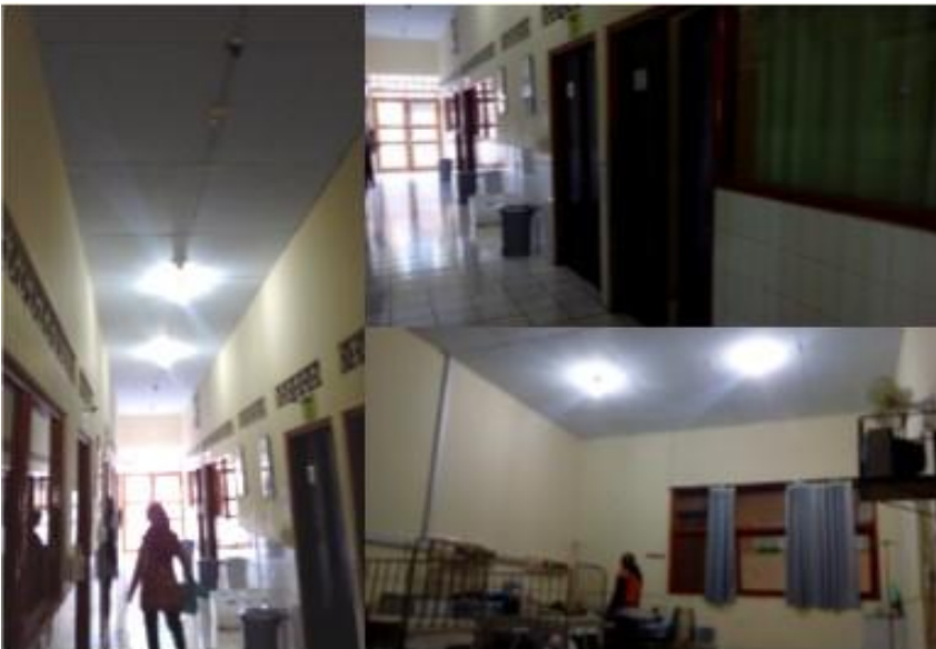
Lampiran 5. Foto ruang rawat anak tanpa sprinkler dan APAR