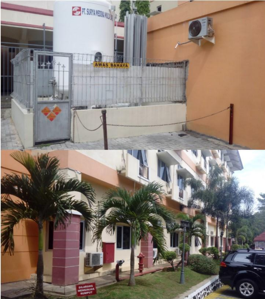
Lampiran 11. Foto luar pelataran rumah sakit