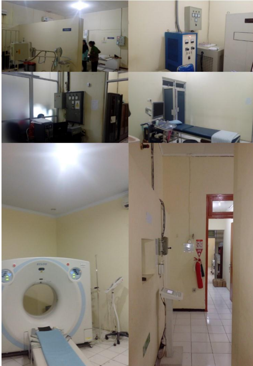
Lampiran 6. Foto ruang radiologi tanpa sprinkle dengan APAR