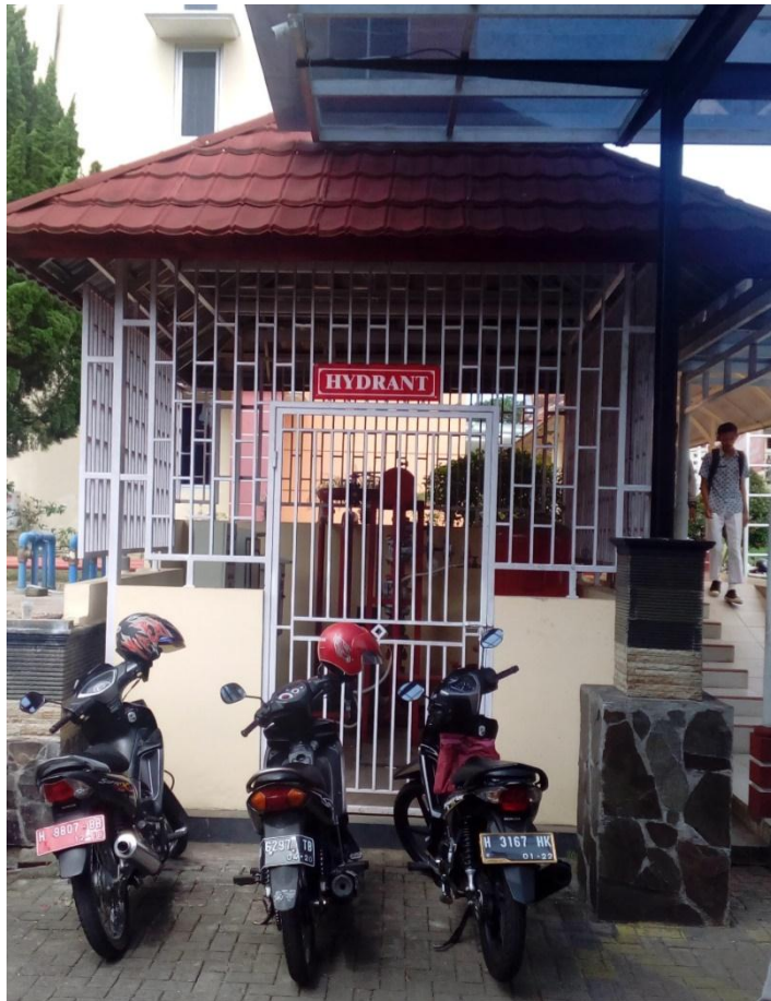
Lampiran 12. Foto hydrant di luar pelataran rumah sakit