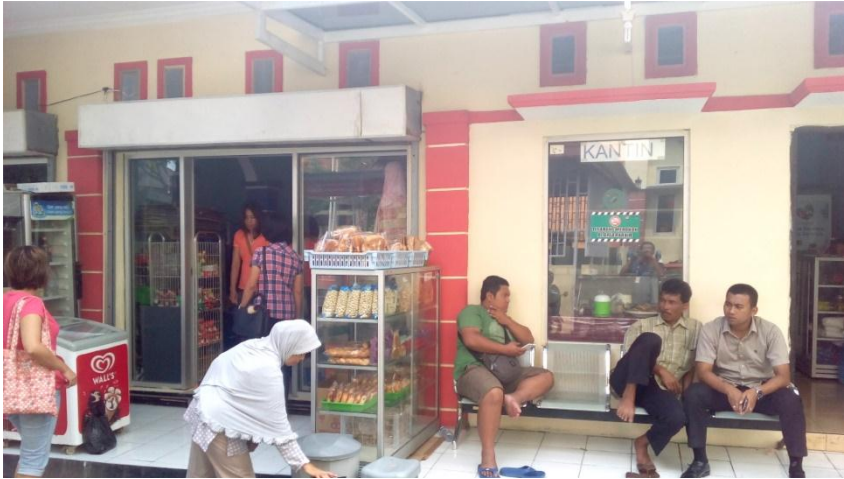
Lampiran 13. Foto kantin rumah sakit tanpa sprinkle dan APAR