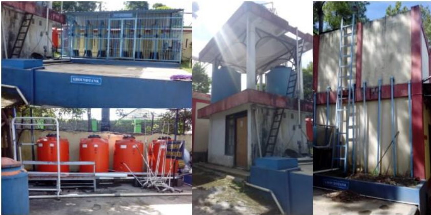
Lampiran 4. Foto ground tank dan roof tank RSUD Salatiga