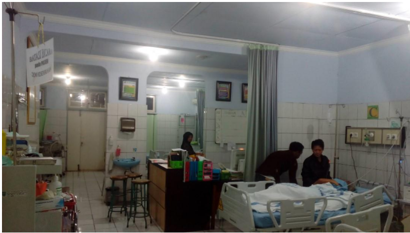
Lampiran 9. Foto ruang HCU tanpa sprinkle dan APAR