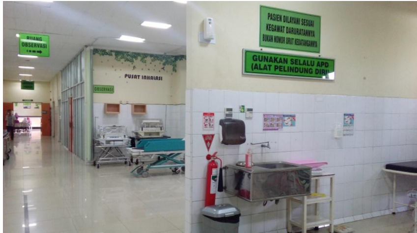
Lampiran 15. Foto IGD tanpa sprinkle dengan APAR

E. SK - Direktur dan Buku P3B-RS Tahun 2007 Dan Rekaman Suara Hasil Wawancara Dengan Nara Sumber (terlampir dalam bentuk foto copy dan CD)