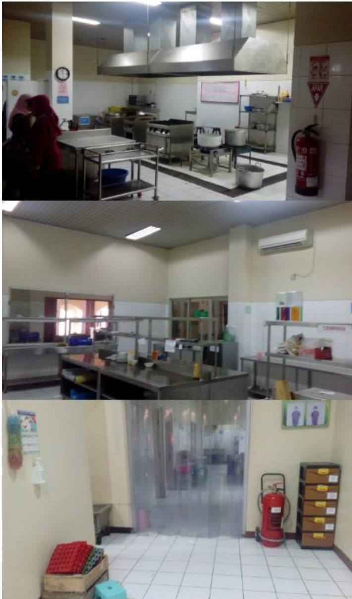
Lampiran 10. Foto ruang dapur instalasi gizi tanpa sprinkle