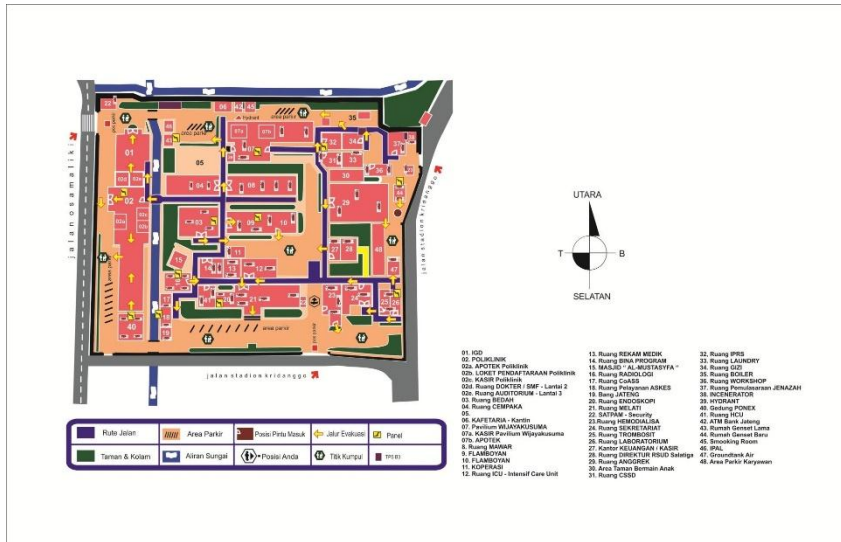
Lampiran 2. Gambar denah evakuasi RSUD Salatiga