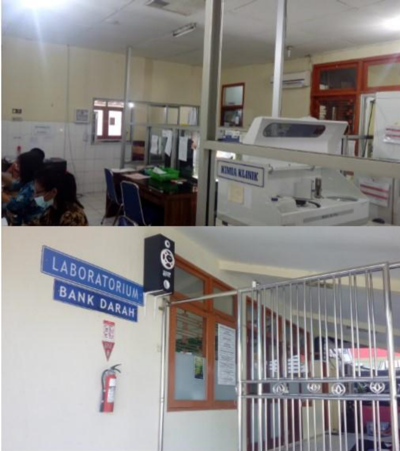
Lampiran 7. Foto laboratorium tanpa sprinkle dengan APAR