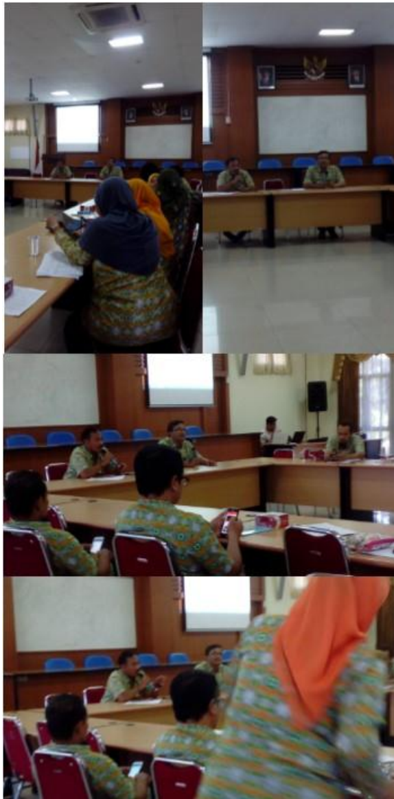
Lampiran 3. Foto kegiatan FGD