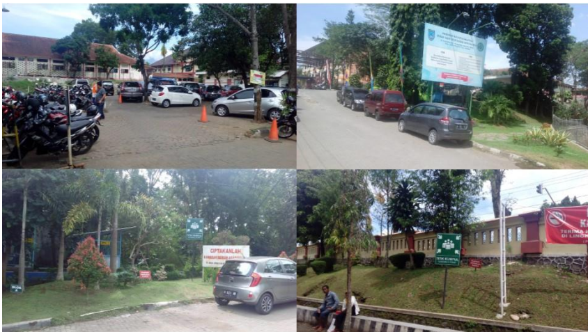
Lampiran 14. Foto area terbuka untuk titik kumpul