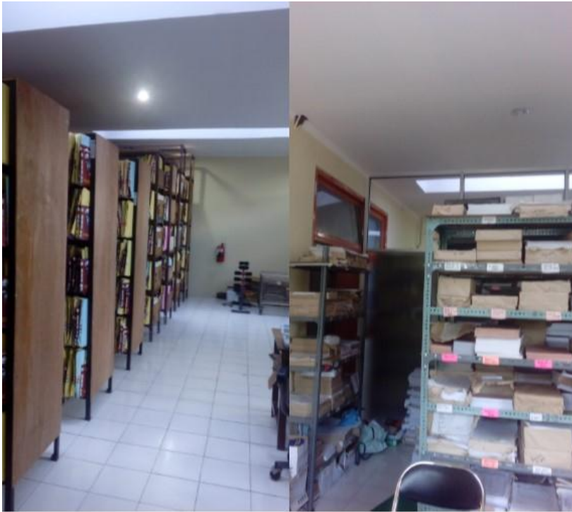
Lampiran 8. Foto ruang rekam medik tanpa sprinkle dan APAR