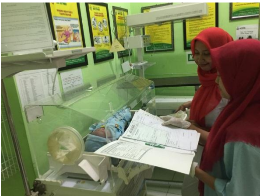
5. Proses Kolaborasi