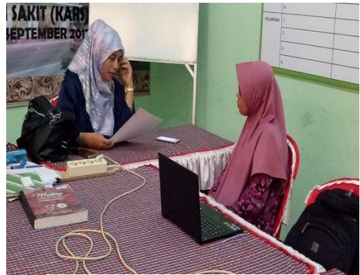
10. Wawancara dengan