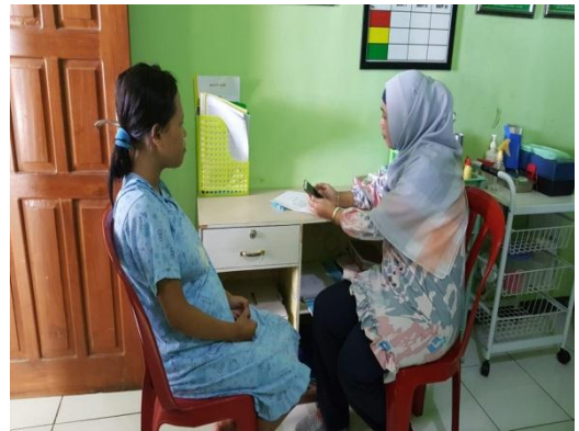
4. Wawancara dengan Pasien