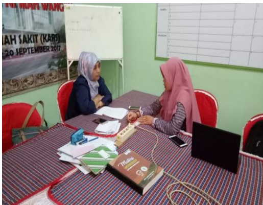
11. Wawancara dengan