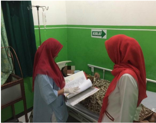
7. Proses Kolaborasi