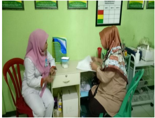
8. Wawancara dengan