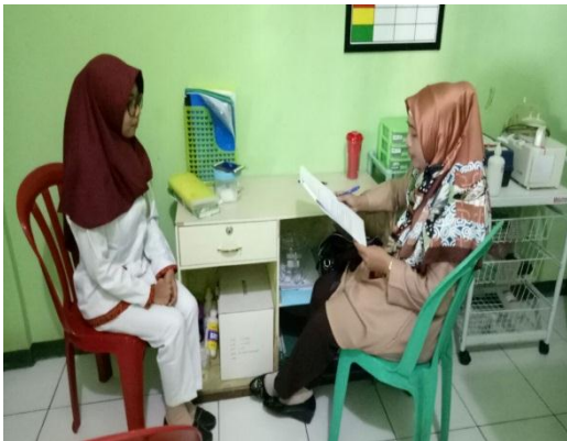
9. wawancara dengan ahli