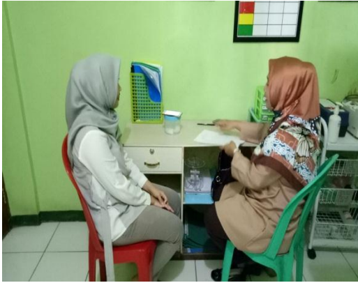
1. Wawancara dengan Dokter