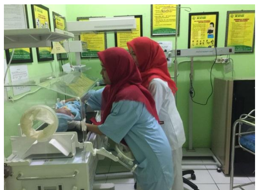
6. Proses Kolaborasi