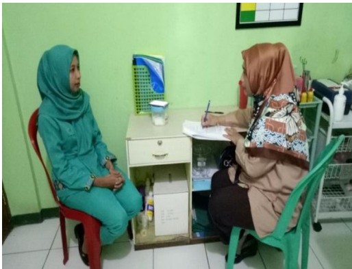
3. Wawancara dengan Bidan