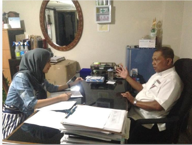
Gambar 1. Wawancara Informan