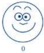
Wong-Baker FACES Pain Rating Scale