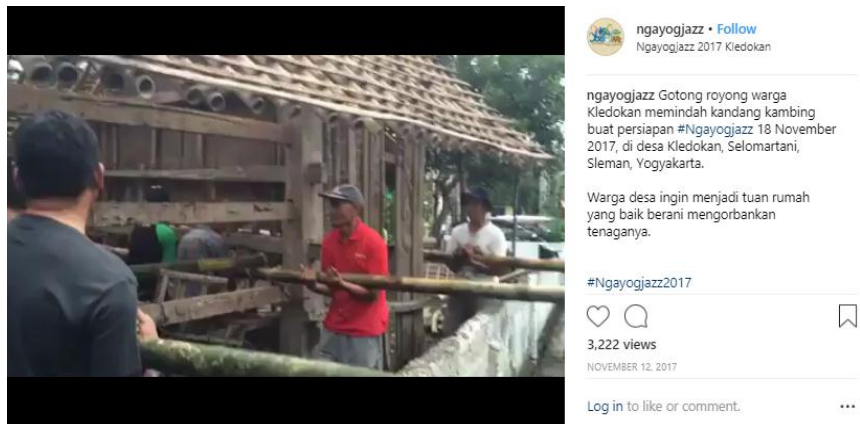
Gambar 3. 16 Video persiapan event Ngayogjazz 2017

Pada gambar 3.16 merupakan unggahan video mengenai persiapan event Ngayogjazz 2017. Dalam video tersebut menunjukkan gotong royong antara penduduk Dusun Kledokan yang berkerjasama dengan panitia Ngayogjazz 2017 dalam mempersiapkan untuk event tersebut.