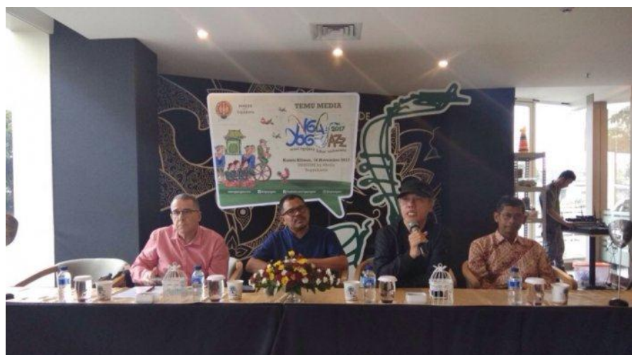
Gambar 3. 8 kegiatan press conference ngayogjazz 2017

Bauran promosi untuk hubungan masyarakat Ngayogjazz 2017 direalisasikan dengan melakukan press conference bersama pemangku kepentingan ( stakeholder ) dan diikuti dengan media relations .