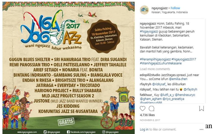
Gambar 3. 13 foto informasi sebagian dari penampil event Ngayogjazz 2017

agar target sasaran tertarik dan penasaran pada event Ngayogjazz ditahun 2017.