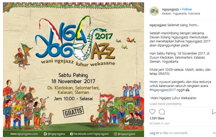
Gambar 3. 25 Pamflet Ngayogjazz 2017