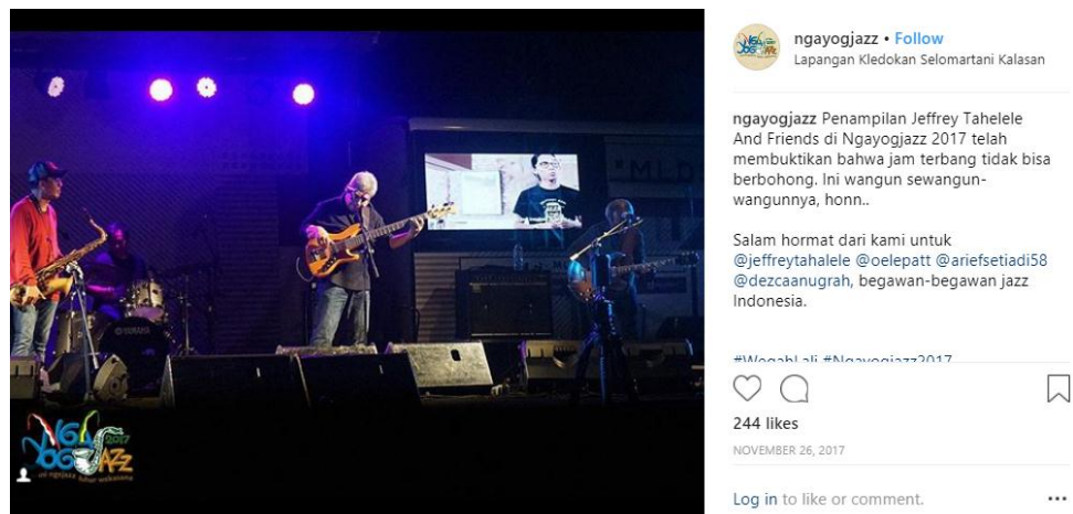
Gambar 3. 2 Contoh Caption yang Digunakan pada Media Sosial Instagram