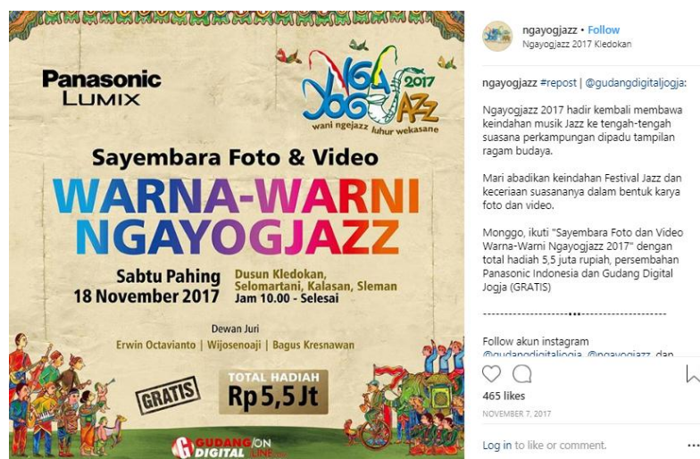
Gambar 3. 14 Sayembara Foto dan Video

dari penampil di event Ngayogjazz 2017. Hal ini diharapkan dapat menarik pengunjung untuk datang langsung menyaksikan grup musik kesukaan dan kesayangan target sasaran di lokasi event Ngayogjazz 2017 diselenggarakan.