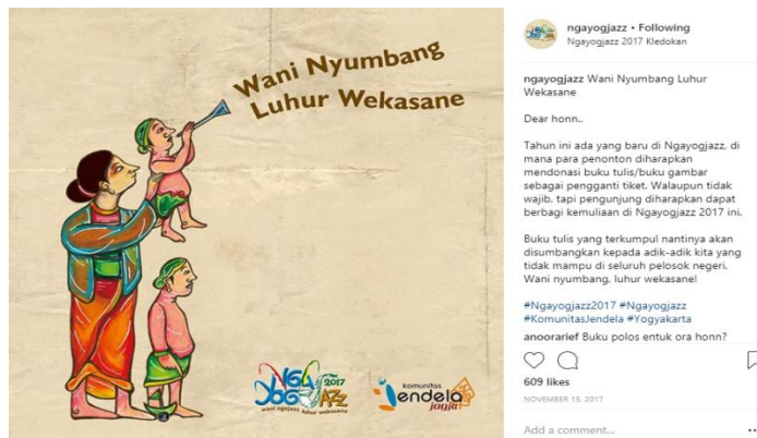
Gambar 3. 17 Wani Nyumbang Luhur Wekasane

Pada gambar 3.16 merupakan unggahan video mengenai persiapan event Ngayogjazz 2017. Dalam video tersebut menunjukkan gotong royong antara penduduk Dusun Kledokan yang berkerjasama dengan panitia Ngayogjazz 2017 dalam mempersiapkan untuk event tersebut.