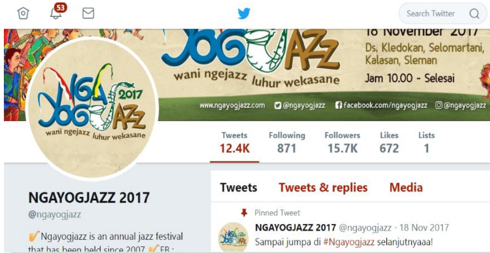
Gambar 3. 5 Contoh Media Sosial twitter Ngayogjazz

Sedangkan pada pemasaran interaktif yang menggunakan media sosial seperti twitter, facebook, dan Instagram .