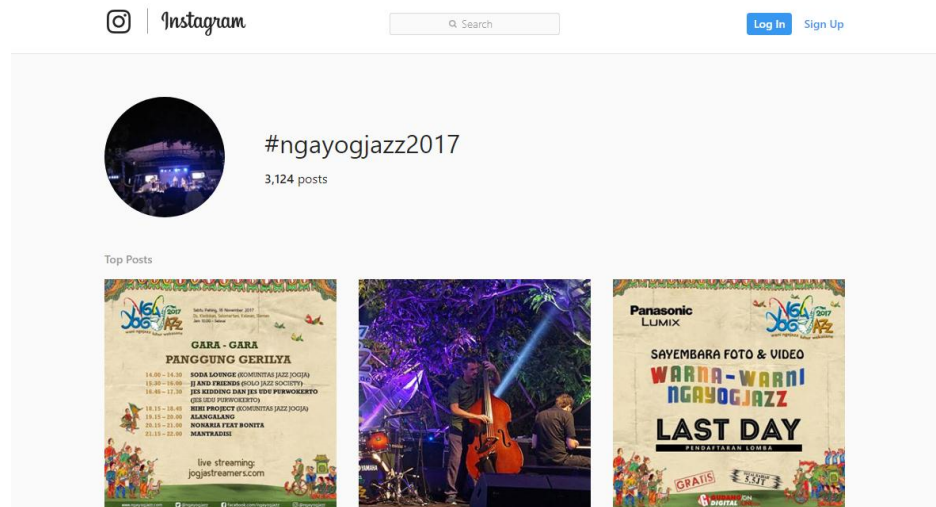
Gambar 3. 9 Hashtag di Instagram Ngayogjazz