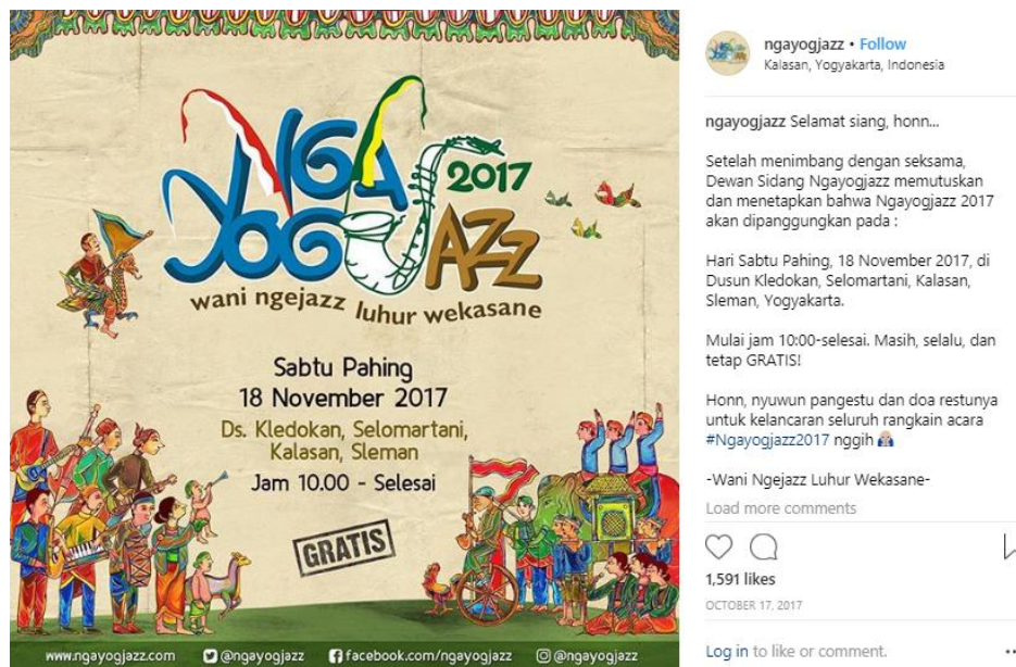
Gambar 3. 11 Unggahan Foto Pertama di tahun 2017

Selain itu, Ngayogjazz juga menyelenggarakan kontes foto berhadiah dan info berbagai workshop. Berikut ini merupakan bentuk dari aktifitas promosi yang dilaksanakan melalui media sosial Instagram dengan akun @Ngayogjazz :