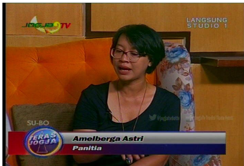
Gambar 3. 4 Kegiatan Promosi Talkshow Di Jogjatv