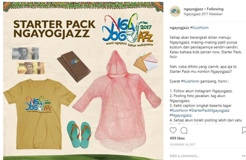
Gambar 3. 22 Kuis starter pack Ngayogjazz

di Jogja Nasional Museum dan Cupable Cafe Pakem, mulai beroperasi dari pukul 15.00 WIB – 22.00 WIB.