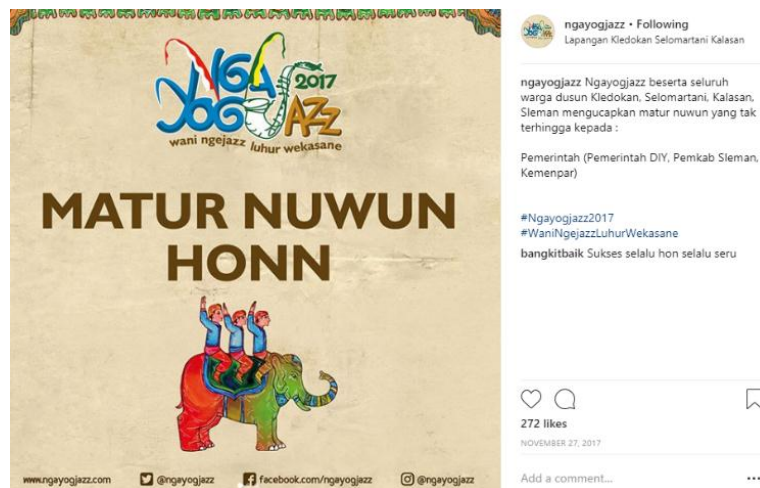
Gambar 3. 24 Ucapan terima kasih dari Ngayogjazz

Pada gambar 3.24 merupakan foto terakhir yang diunggah oleh Ngayogjazz ditahun 2017. Foto ini sebagai penutup yaitu ucapan terima kasih untuk pihak-pihak yang terlibat dalam event Ngayogjazz 2017.