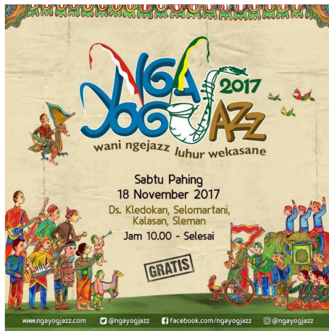
Gambar 3. 1 Contoh Pesan Promosi Ngayogjazz 2017

Dalam perancangan pesannya pada event Ngayogjazz 2017 ingin mengembalikan musik jazz pada basic awalnya yang merupakan musik jalanan. Namun di era sekarang ini musik jazz dikenal dengan musik yang bergenre elite , maka dari itu di event Ngayogjazz ini ingin membumikan dan kembali menyederhanakan musik jazz.