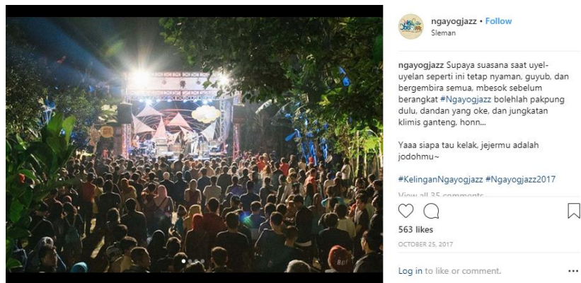
Gambar 3. 26 Foto event Ngayogjazz tahun 2016

Menurut peneliti dalam menumbuhkan minat target sasaran tersebut sudah tepat. Ngayogjazz mempengaruhi target sasaran dengan cara mengunggah foto dan video keberhasilan event Ngayogjazz tahun sebelumnya. Sehingga target sasaran menjadi penasaran dengan event yang akan diselenggarakan tersebut. Selain itu, Ngayogjazz juga mengunggah foto tentang informasi penampil event Ngayogjazz 2017 sehingga target sasaran berminat untuk menonton kelompok musik kesayangannya. Berikut adalah foto event Ngayogjazz tahun lalu yang diunggah untuk menarik target sasaran agar menunjungi event Ngayogjazz 2017 :