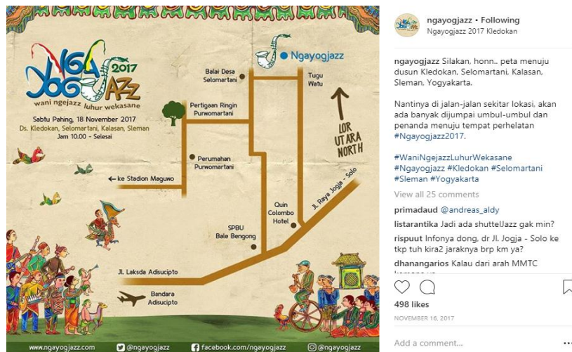
Gambar 3. 19 Peta menuju lokasi event Ngayogjazz 2017

Dalam gambar 3.18 menjelaskan bahwa event Ngayogjazz 2017 mempunyai lima panggung yang masing-masing panggungnya memiliki nama sesuai tema, yaitu Gara-Gara Panggung Seribu, Gara-Gara Panggung Gerilya, Gara-Gara Panggung Doorstoot, Gara-Gara Panggung Markas, dan Gara-Gara Panggung Merdeka. Gambar diatas juga menjelaskan rundown acara pada masing-masing panggung, sehingga pengunjung dapat memilih untuk hadir di panggung pilihannya.