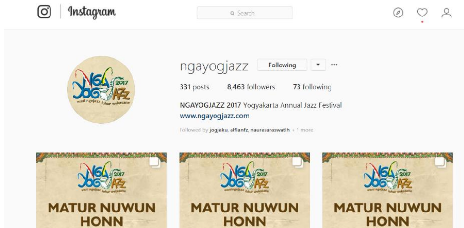
Gambar 3. 7 Contoh media sosial Instagram Ngayogjazz