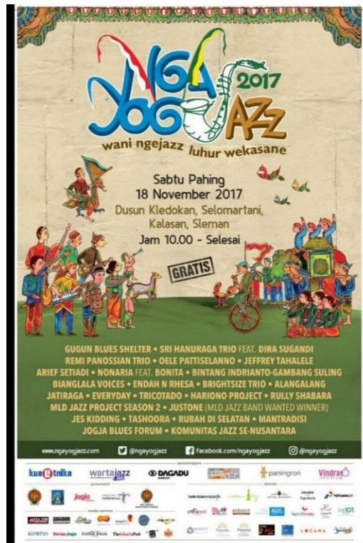
Gambar 3. 3 Contoh Desain media massa Ngayogjazz 2107