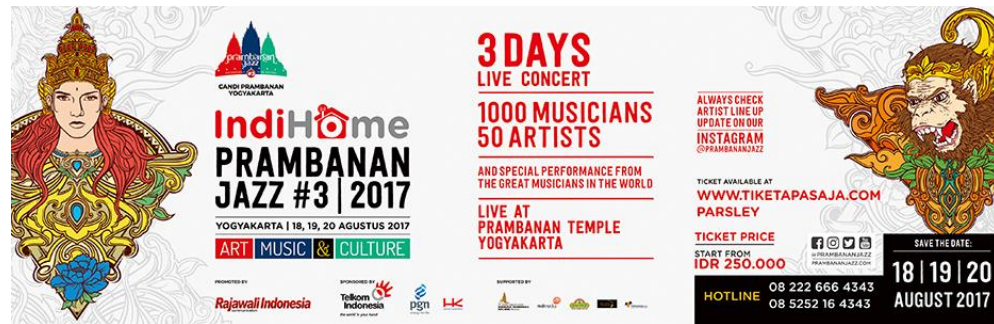
Gambar 2.3 Baligho Event Musik Prambanan Jaz 2017

Prambanan Jazz tahun 2017 kembali hadir di hadapan kita semua pencinta musik di seluruh tanah air, selama 3 hari yaitu pada tanggal 18, 19, 20 Agustus 2017 mendatang di kompleks Taman Wisata Candi Prambanan, Yogyakarta. Prambanan Jazz 2017 kali ini mengambil tema Art, Music & Culture . Art adalah mahakarya Candi Prambanan itu sendiri sebagai sebuah karya seni dunia, sebuah mahakarya warisan budaya leluhur kita, sebuah karya anak bangsa yang harus selalu kita jaga, lestarian & kita perkenalkan kepada kancah dunia internasional. Music adalah festival musik itu sendiri, sebuah bentuk apresiasi kita terhadap Candi Prambanan dengan segala kemegahannya yang kita satukan menjadi sebuah perpaduan yang hebat antara mahakarya Candi Prambanan & musik berkelas dunia. Untuk itu kami akan selalu menghadirkan musisi dunia dan musisi-musisi terbaik dari negeri kita sendiri. Dengan harapan