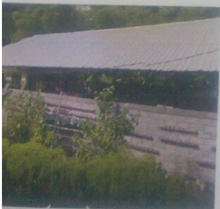
TPS 3R PURWO BERHATI