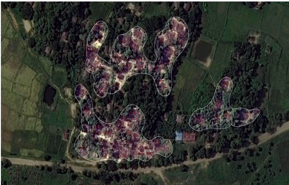
Gambar Rakhine setelah terjadinya konflik