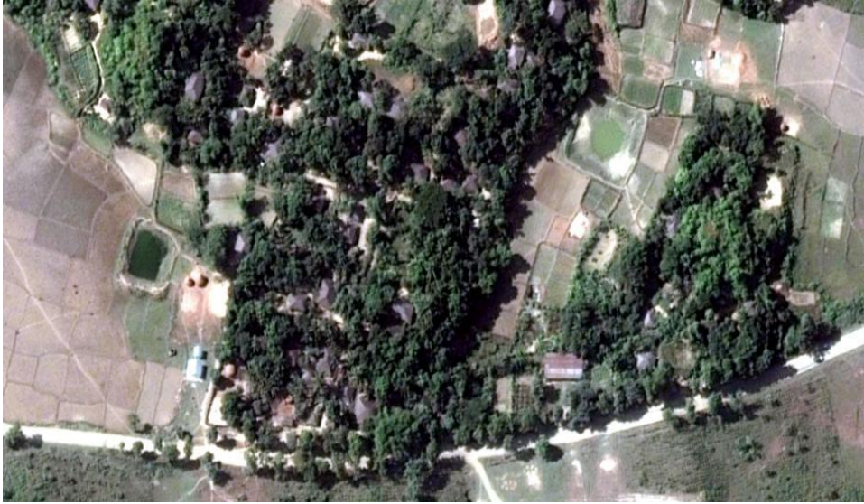
Gambar Rakhine sebelum terjadinya konflik