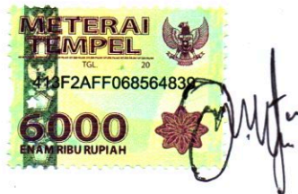
Arsil Nyong, S.Sos