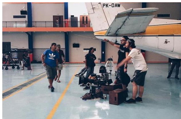
Gambar 2. 5 Saat Produksi TVC Djarum