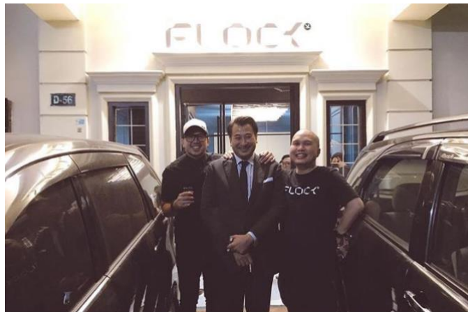
Gambar 2. 1 Flock Company