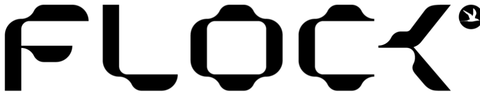
Gambar 2. 4 Logo Flock Company Jakarta