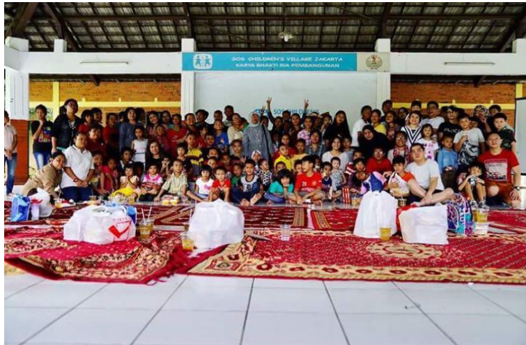
Gambar 2. 6 Flock Berbagi di SOS Childern Village Indonesia, Cibubur

Untuk memperingati akhir tahun juga hari Natal, Flock mengadakan bakti sosial di SOS Childern Village Indonesia, Cibubur.