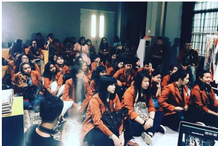
Gambar 2. 10 Flock Sharing Session bersama Mahasiswa Universitas Petra, Surabaya tahun 2017

Flock Company selalu membuka diri bagi siapa saja yang mau belajar dengan mereka. Karena berbagi ilmu kepada orang lain tidak ada ruginya. Seperti acara kunjungan dari Universitas Petra, Surabaya tahun 2017.