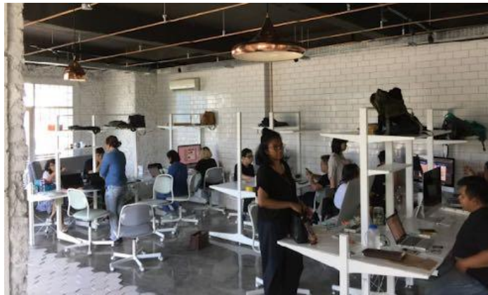
Gambar 2. 3 Ruang Flock Creative