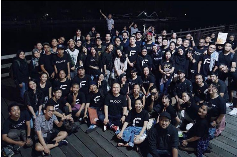
Gambar 2. 7 Flock Buka Bersama

keluarga Flock Company, seperti yang baru saja dilakukan pada akhir Mei lalu.