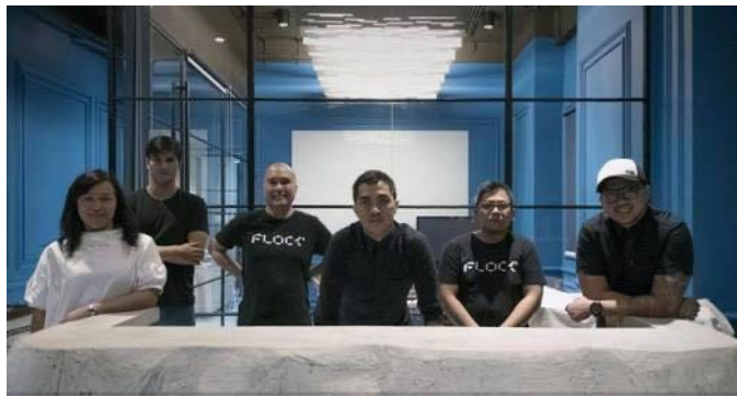
Gambar 2. 2 Pendiri Flock Company Jakarta

yang dirasa mereka belum bisa memberikan pelayanan yang lebih kepada klien, melihat perkembangan dunia periklanan yang terus berubah setiap tahunnya. Flock Company is a true collaboration-centric hub focusing on the communal spirit of delivering groundbreaking creative solutions to elevate brands to soaring heights through 3 core pillars: Creative storytelling - Brand & Design, Interactive Communication - Social Media & Technology, dan Content Creation - Still or Moving Production ( www.flockcompany.com/ diakses pada hari Senin tanggal 14 Mei pukul 13.00 WIB)