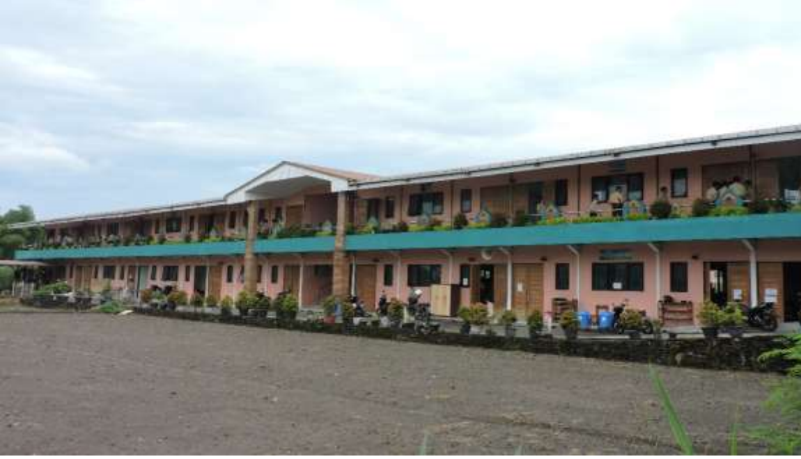
صورة البناء المسكان الطلاب