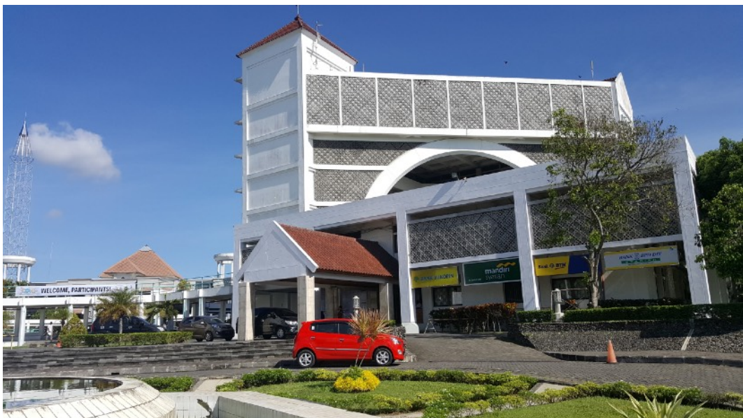
Gedung Rektorat B