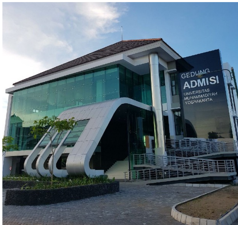
Gedung Admisi UMY