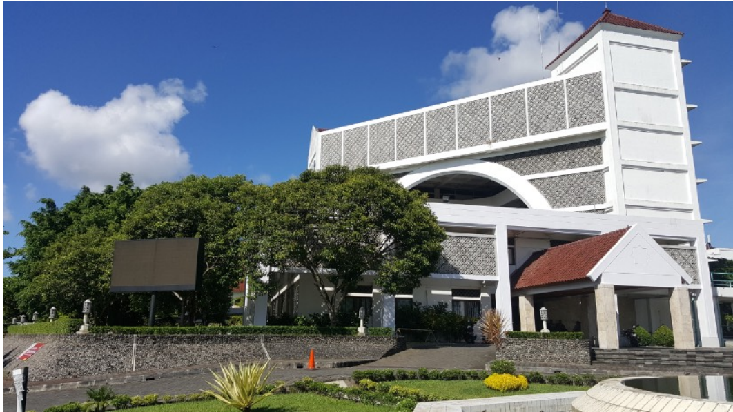
Gedung Rektorat A