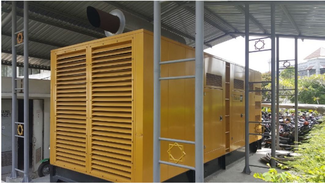
Genset Zona AR