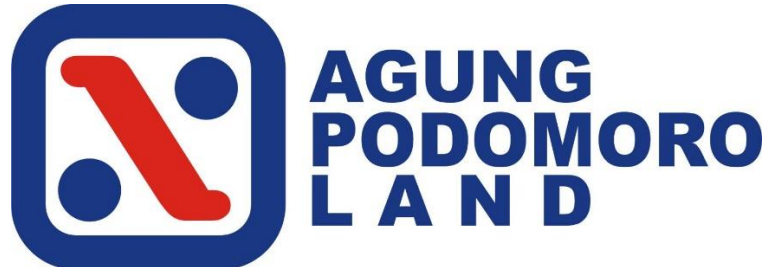
Gambar 2 . 4