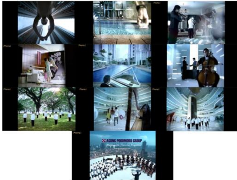
Gambar 2. 3